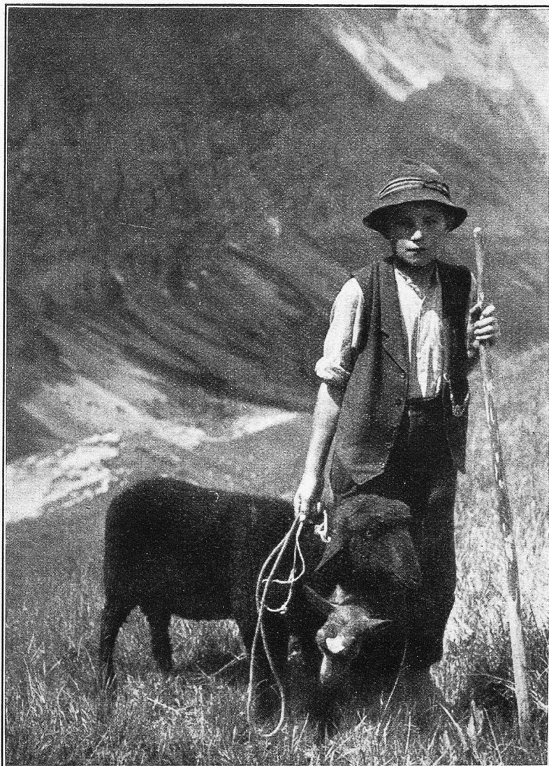
Jungfer Unterwaldner. Ob Emmetten am Pfade zum Ober-Bauer.

Das Geschrei der entsetzten Mägde hatte die Knechte schnell geweckt und alsbald war einer von ihnen die Schneebahn zu Sepp hinübergeweiht, der in allerlei solchen Notfällen Rat wußte und selbst in seinem Leben noch nie einen Arzt gebraucht hatte. Als der aber nach kurzer Frist hereintrat und den nun stiller gewordenen Kranken ängstlich beschaut hatte, sagte er bedenklich: „Da kann ich nichts helfen, es muß sogleich ein Doktor herbei. Wer von Euch wagt es, für den Meister nach dem Tal hinabzugehen?“ — Die Knechte schauten sich verlegen