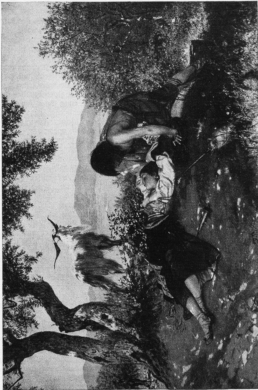
Eigentum der Zürcher Kunstgesellschaft.