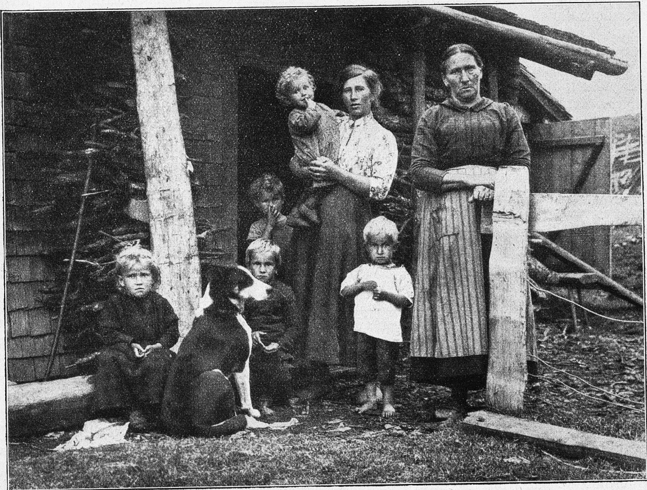
Bergvolf auf Eggbergen ob Bürglen.