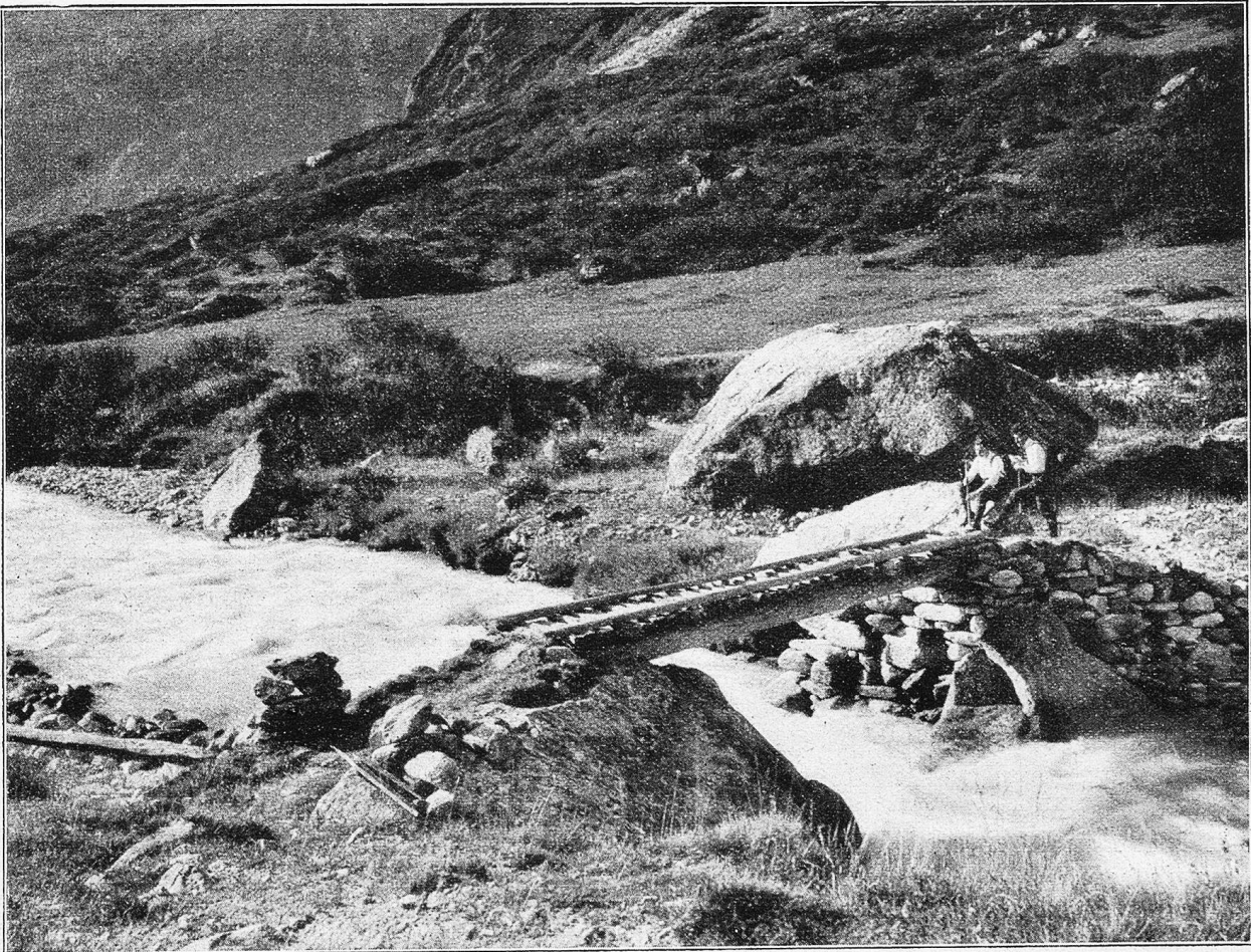
Bei der Brücke: Hinter Rötze oberhalb der Göschenenalp. Übergang zur Kehlenalp.

„Sägewerk — wie — was? Und was weiter noch? Vielleicht auch noch die Bäckereien zum Mehl und die Zurichtung fertiger Blockhäuser? Hä?!“ Miß Dobbs fuhr sich jetzt etwas erregt durch das kurzgeschnittene graue Haar. Auf das Sägewerk war sie ja selbst noch nicht ge-