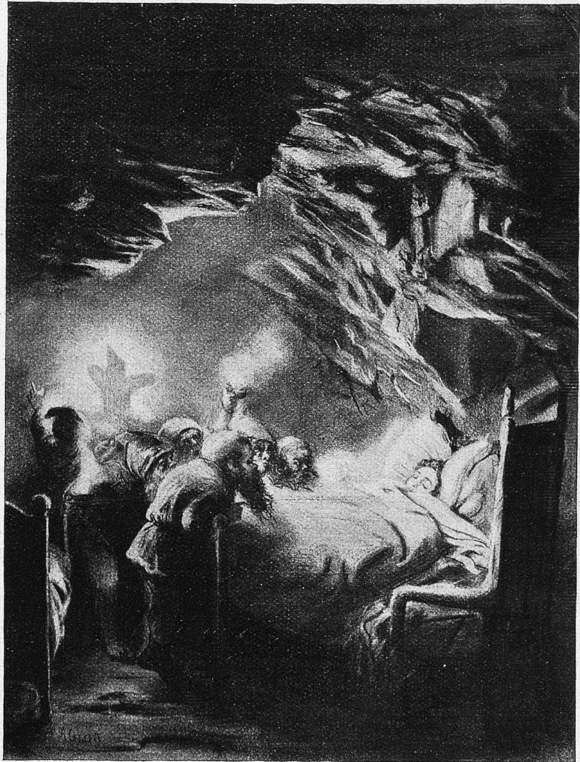
Aug. Corrodi: Schneewittchen.

Wer böpperlet a der Chammer a? Nu ich bis, seit de Heiri. Se pad di hei! Was witt du da? Nu öppiä! seit de Heiri. De schlichicht ja, wie wennd gftole hettischt! Chumm lueg nu! seit de Heiri. De machscht na Stämpeneie zletscht! Cha scho sy, seit de Heiri. Und lies i di is Chämmerli — D las mi! seit de Heiri — Se wärs dänn mit mim Schlaf verbi. Natürli! seit de Heiri — Und wärischt i mim Chämmerli — D wär i! seit de Heiri — Se wettischt, bis taget, bi mer sy. Bis taget, seit de Heiri. Und wettischt die Nacht bi mer sy — Di ganz Nacht, seit de Heiri — Se fürch i, chämisch wider gli. Gli wider, seit de Heiri. Was gscheh mag dänn im Chämmerli — Was gscheh nu! seit de Heiri — Das rat i der, das bhalt für di! Verstaht si! seit de Heiri.