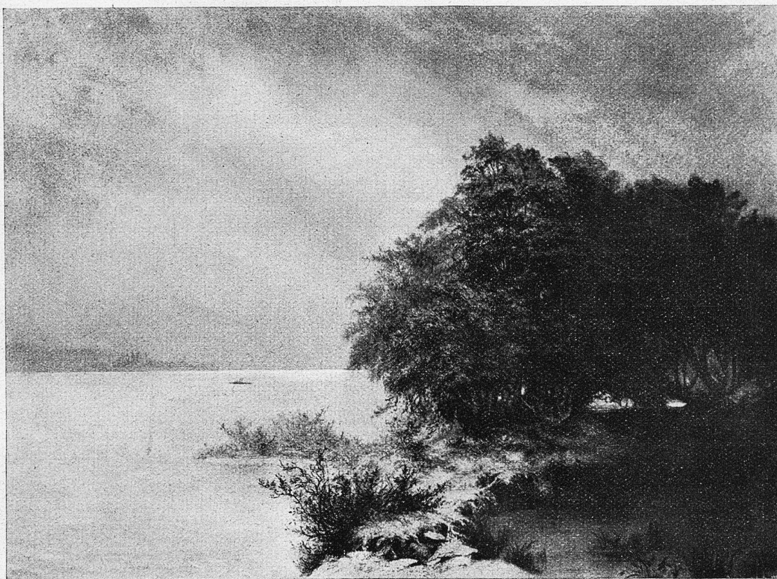
Aug. Corrodi: Herbststimmung am Zürichhorn.

„De Herr Dokter“. Sie sind ohne Asteris ländliche und städtische Kleinbilder nicht denkbar. Aber sie geben sich in der Sprache und in der Handhabung des klassischen Versmaßes natürlicher. Plastische Milieuschilderung, Kenntnis des Details, liebevolles Eindringen ins ländliche Pfarrhaus wie ins Doktorhaus sind charakteristisch für seine Darstellungsweise. Gerne leuchtet da und dort ein Dichtlein Humor auf.