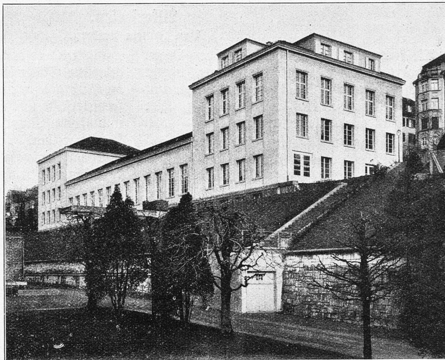
Wasserbautechnisches Institut der Eidg. Techn. Hochschule.

Technischen Hochschule ihre Existenzmittel nicht und freuen wir uns während der Jubiläumsfeiern darüber, daß wenigstens ein Werk in Stein und Marmor von eidgenössischem Gemein Sinn und tüchtiger Schweizerart für uns vor den Völkern zeugt.