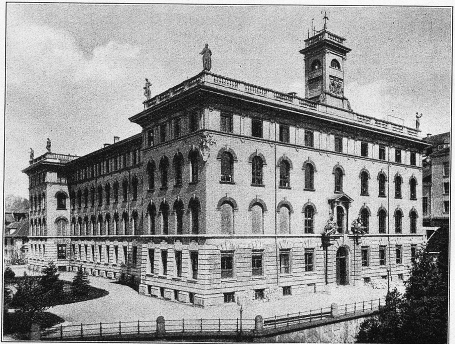
Physikgebäude der Eidg. Techn. Hochschule.

Wohl hat der Ausbau der stolzen Schule Millionen von Franken gekostet und wird noch weitere Millionen für ihre Weiterexistenz fordern, aber wenn der Staat irgendwo Geld nutzbringend anlegen kann, so gewiß hier: vom