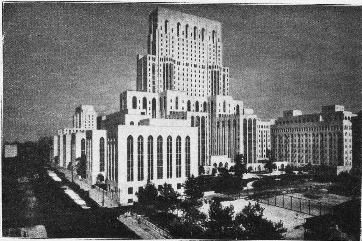
Die Gebäude der medizinischen und naturwissenschaftlichen Fakultät der Cornell-Universität in New York.

rikanischen Universitäten besucht hatten, daß häufig die Institute und Kliniken zu klein, schlecht eingerichtet und keineswegs auf der Höhe der europäischen seien. Das hat sich in den letzten Jahren gründlich geändert. Einer der schönsten Wolkenkratzer von New York heberbergt heute die naturwissenschaftlichen Institute und Kliniken der Cornell-Universität. Zahllose wundervoll eingerichtete Laboratorien, riesige Bibliotheken, Forschungsinstitute und mit den modernsten Hilfsmitteln ausgestattete Kliniken sind in dem riesigen Bau, der erst im Herbst 1932 eingeweiht wurde, vereinigt. Auf der andern Seite New Yorks, am Hudsonfluß, liegen die gleich gewaltigen, auch erst wenige Jahre alten Gebäude-Komplexe der Columbia-Universität, der größten Universität Amerikas.