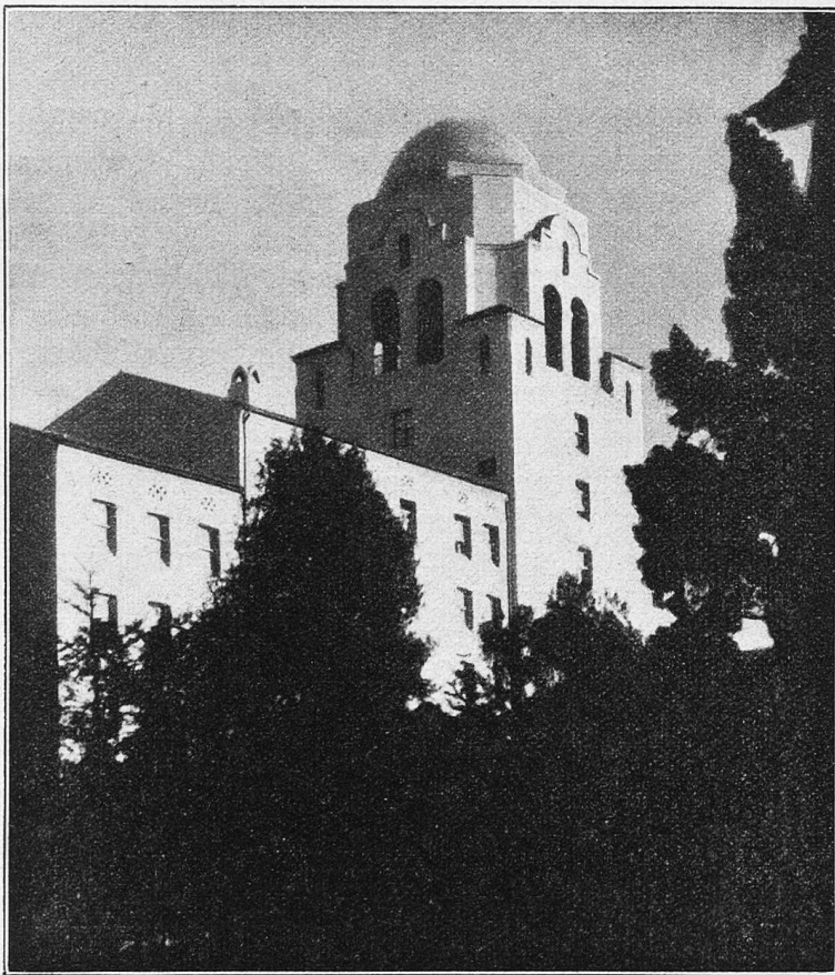
Ein Institut der Universität von Californien bei San Franzisko.

Heute sind die Zeiten des Überflusses auch für die amerikanische Wissenschaft wohl für immer vorüber. Es fragt sich sehr, ob in den kommenden Jahren größter notwendiger Sparsamkeit die luxuriösen Prachtbauten der Wissenschaft nicht mehr als eine Last, denn als Vorteil wirken werden. Denn sie müssen ja auch erhalten werden, und gar nicht selten haben sich die Universitäten im Vertrauen auf