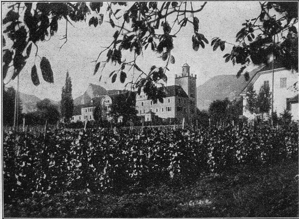
Schloß Salenegg in Maienfeld.

Wann Maienfeld als menschliche Siedlung entstanden, kann heute von Geschichtsforschern nicht mit Sicherheit festgestellt werden. Bestimmt ist nur anzunehmen, daß Maienfeld auch eine römische Siedlung war, als Station „Magia“ bei den römischen Militärstraßen verzeichnet wurde und als Stützpunkt für durchwandernde Truppen und Völkerteile gegolten haben mochte. Aus jener Zeit sprechen verschiedene römische Münzfunde. Kundige Grabungen und Nachforschungen dürften im umliegenden Gelände manch interessante, aufschlußreiche Gegenstände zutage fördern. Bei den vielen Stürmen, die in den letzten zwei Jahrtausenden über jene Gegend gegangen sind, ist es wohl möglich, daß Maienfeld nicht immer auf demselben Fleck gestanden haben mag. In der nachrömischen Zeit finden wir für die Ortschaft „Magia“ die Namen „Lupinis“, „Lupinus“, „Lopine“ verzeichnet, welche bis ins 13. Jahrhundert gebräuchlich waren. Im Jahre 1295