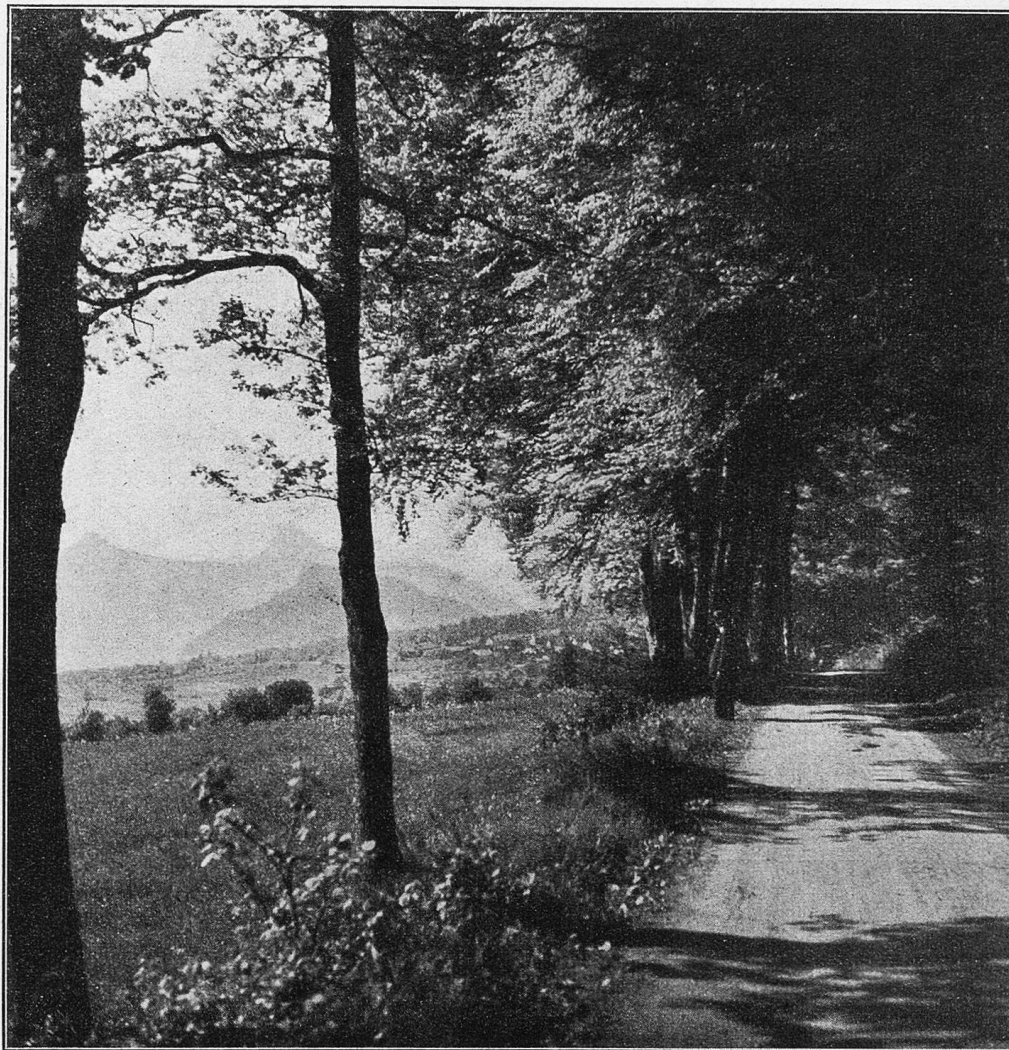
Blick nach Jenins.