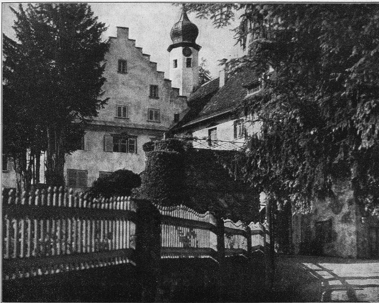
Schloß Botmar, Malans.