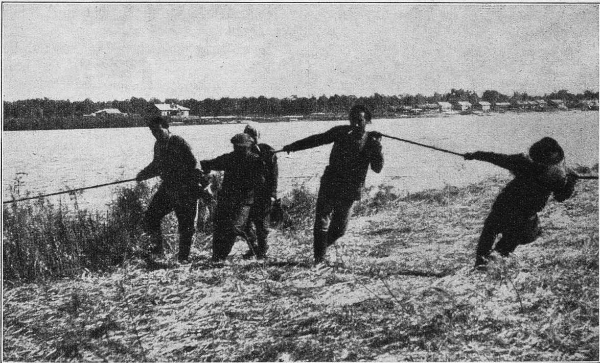
Beim Lachsfang: Das Netz wird eingezogen.