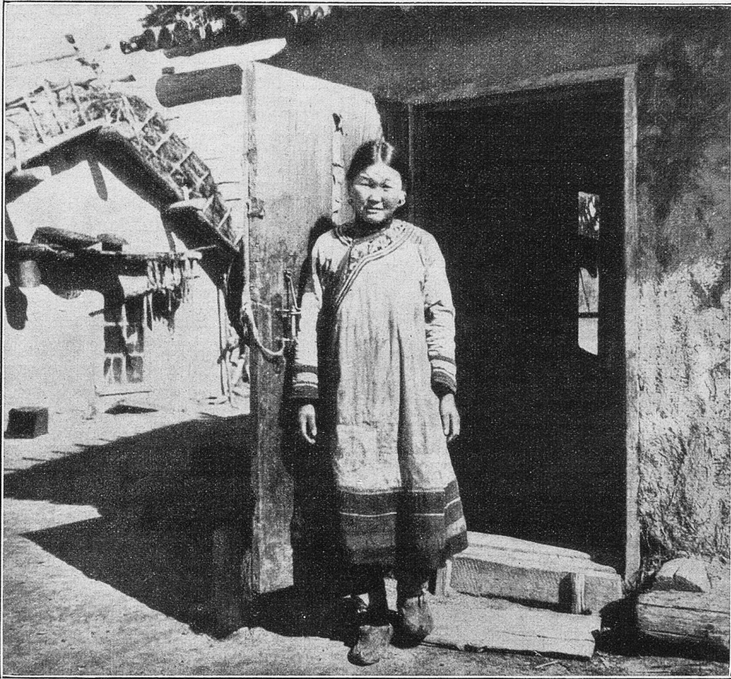
Vor der „Fanse“.

überrascht. Das dunkle Braunrot der Gesichter, die bunte Kleidung vermitteln sofort den Eindruck nordamerikanischer Rothäute. Nur die kurze Schädelform, die hervortretenden Backenknochen, die eingedrückte Nase, die weit auseinanderstehenden Augen mit der typischen Mongolenfalte kennzeichnen die Artverschiedenheit. Die Gestalt ist gedrungen, Hände und Füße auffallend klein. Die pechschwarzen, strähnigen Haare tragen Männer wie Frauen in kurzen Zöpfen, die fest mit roten Schnüren umwickelt sind. Hauptbestandteil der Kleidung ist ein hemdartiges Wams aus Tuch oder gegerbter Fischhaut. Alle Säume, der Gürtel, Ärmel und Hosen sind mit breiten Streifen benäht, die bunte, rot und blaue Ornamentierung tragen. Armbänder, kleine Messingblättchen und ähnliches, sind ein beliebter Schmuck, häufig sieht man auch noch Ohr- und Nasenringe. Als wesentlich für den Gesamteindruck wäre noch die Weise zu bezeichnen, die Männer, Frauen und Kinder mit gleicher Leidenschaft rauchen.