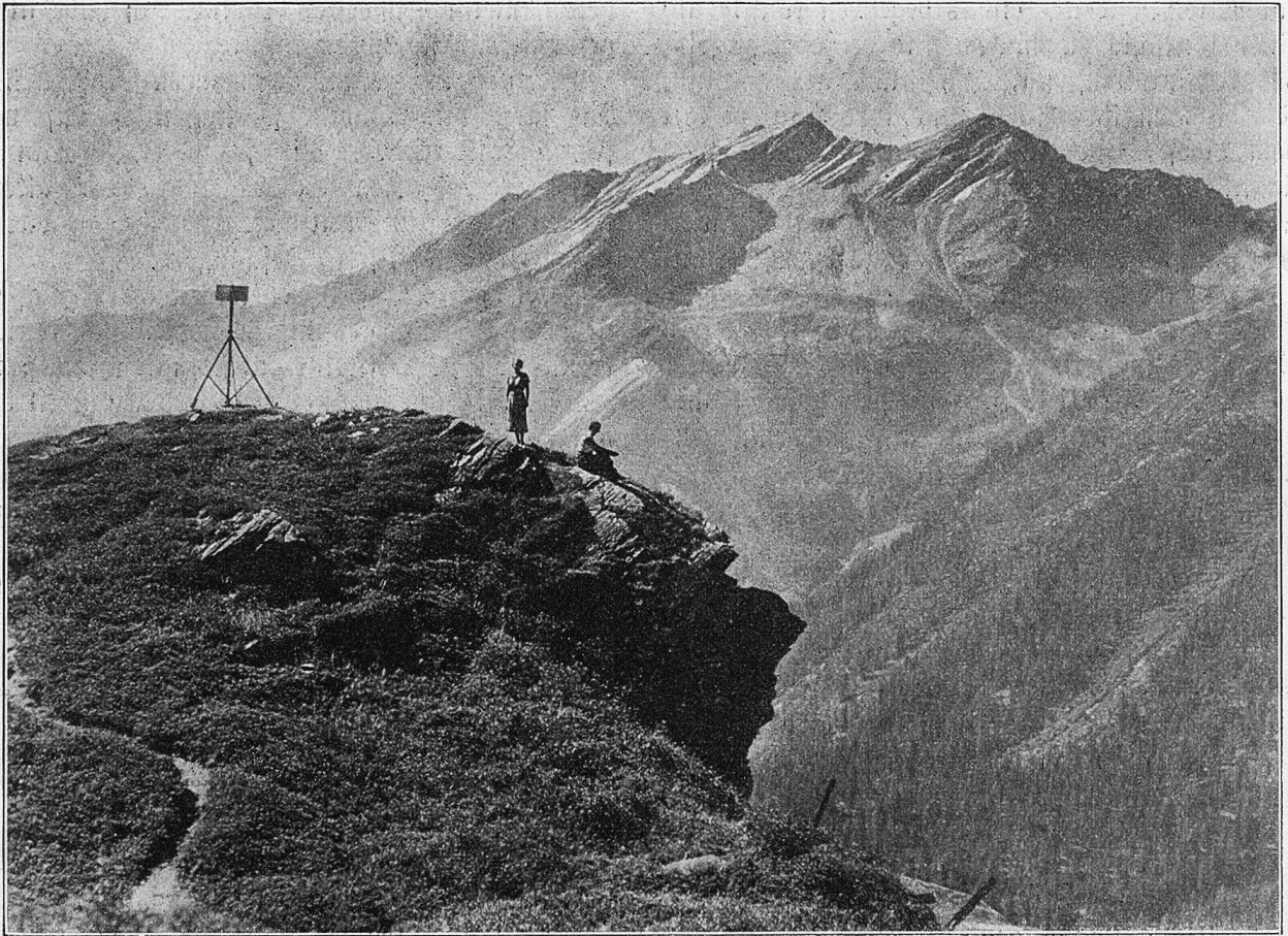
Auf sonniger Höhe bei San Bernardino.