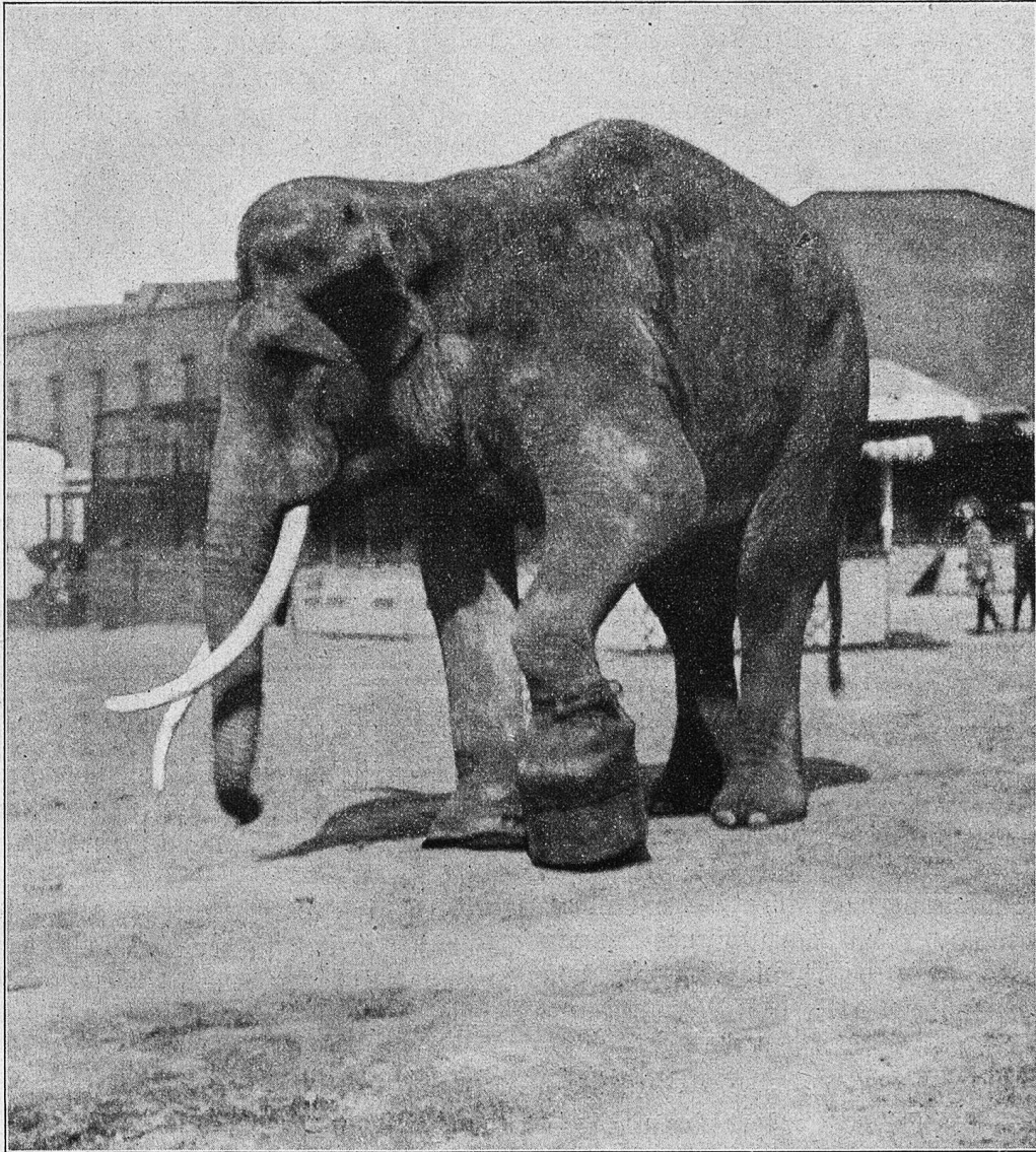
Elefant mit Prothese.

sie sich nicht heran. Vielleicht hielt sie dessen Fesselung auch nicht für notwendig.