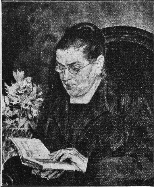
Jean Affeltranger: Damenportrait.

das Leben als Geschenk und das Werk als dieses Lebens Wesentlichstes zu betrachten, sie verbieten ihm, viel aus sich selbst zu machen. Der Lebensernst, ihm und seinem Werke eigen, vermählt sich