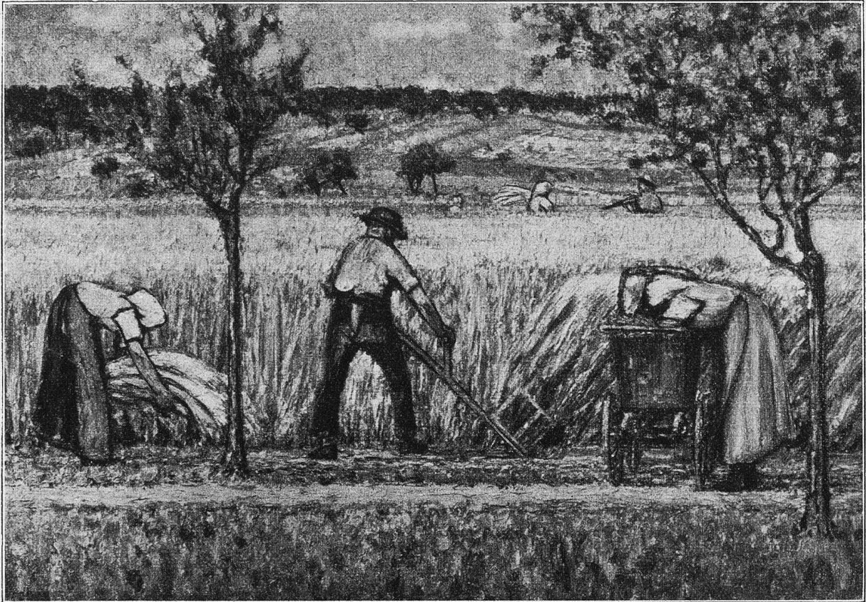
Ernte. Nach einem Gemälde von Jean Affeltranger.

eingesessene, in vielen Fällen leider gerechtfertigte Mißtrauen des Volkes gegenüber allem Künstlertum, daß des Künstlers Mutter auf den freudigen Bericht des ersten großen Bildverkaufs im Münchner Glaspalast nur die lakonische Antwort fand: „Du verdienst dini Sachringer als mir!“ Wer hörte da nicht auch zugleich das Urteil des alten Töfemer Gemeindeammanns Heer über seinen Sohn, den „Fabelschreiber“!