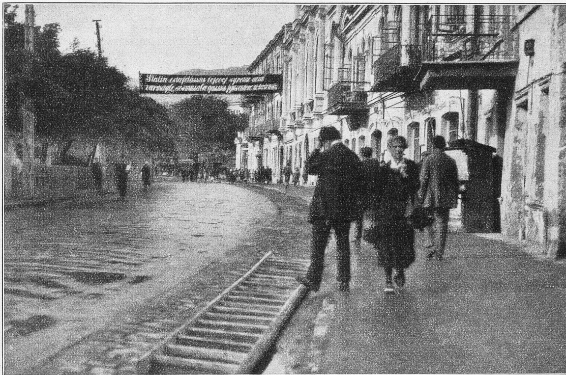
Yalta. Kommunistische Propaganda in tartarischer Sprache (mit lateinischen Buchstaben).

ten der Herzogin und gingen in die Gefindestube hinunter.