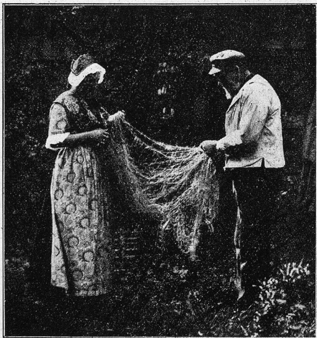
Helgoland. Beim Ausbessern des Netzes.

Die Landungsbrücke führt zu einem kleinen, engen Städtchen, das modernen, etwas farblosen Charakter trägt. Die Häuser rücken nahe aneinander heran. Straßen und Gäßchen schlängeln sich durch. Es gilt, den knappen Boden tüchtig auszunutzen. Am Ufer warten Seeleute und Fischer auf Arbeit, und kaum ist man an Land, wird man von jungen Helgoländerinnen mit Angeboten von Pensionen und Hotels bestürmt. Die Insel ist auf die Fremden angewiesen. Wie würden sonst die etwa 3000 Ansässigen ihr Leben fristen auf einem Boden, dessen Felsen nur mit einer sehr dünnen Humusschicht überzogen sind. Als einziges fruchtbares Gelände fand ich einen gro-