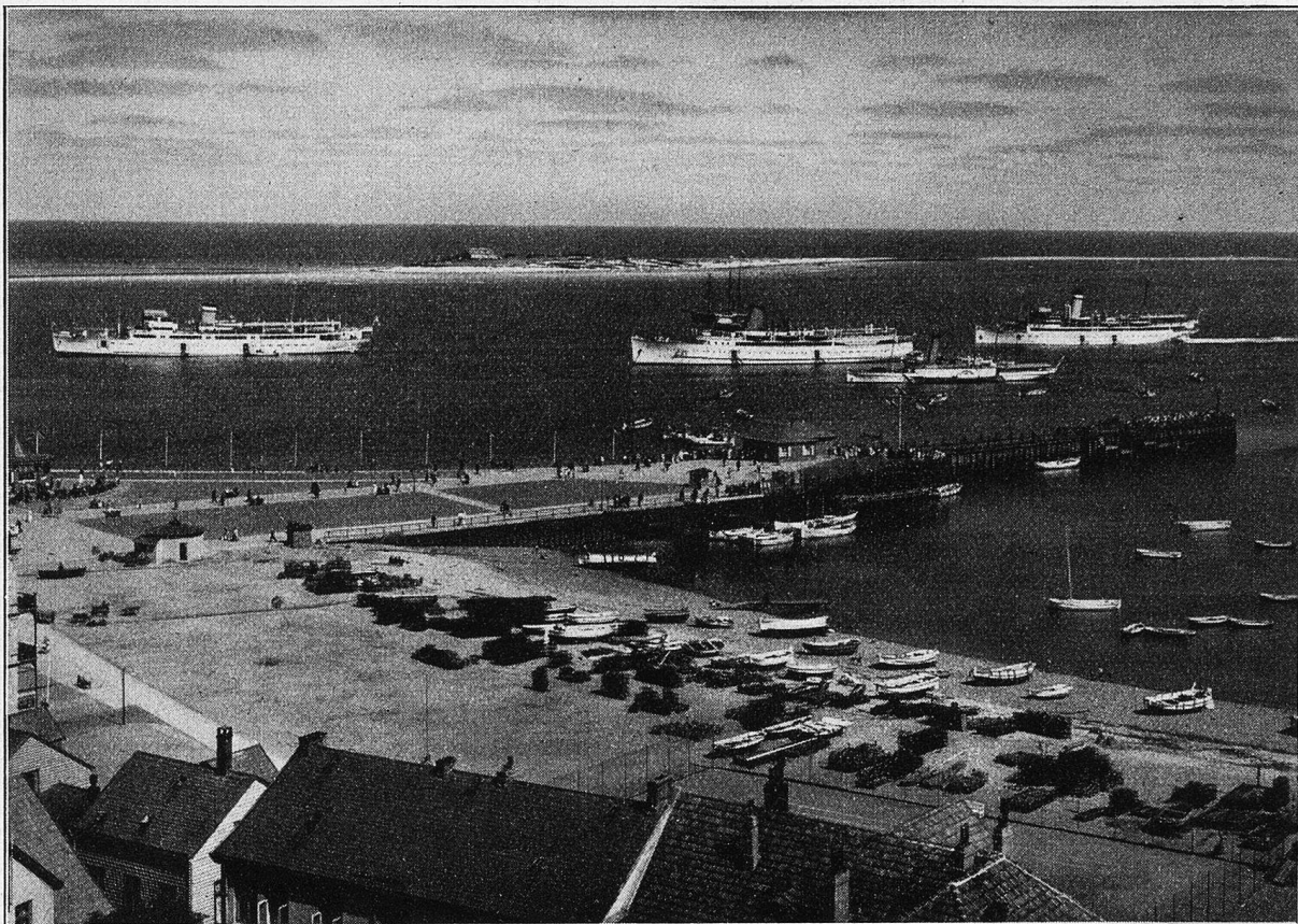
Helgoland. Reede und Düne.

Schiffe und Überseedampfer, denen gegenüber unsere „Cobra“ gar bescheiden sich ausnahm, ob schon sie durchaus sich auch zeigen lassen durfte.