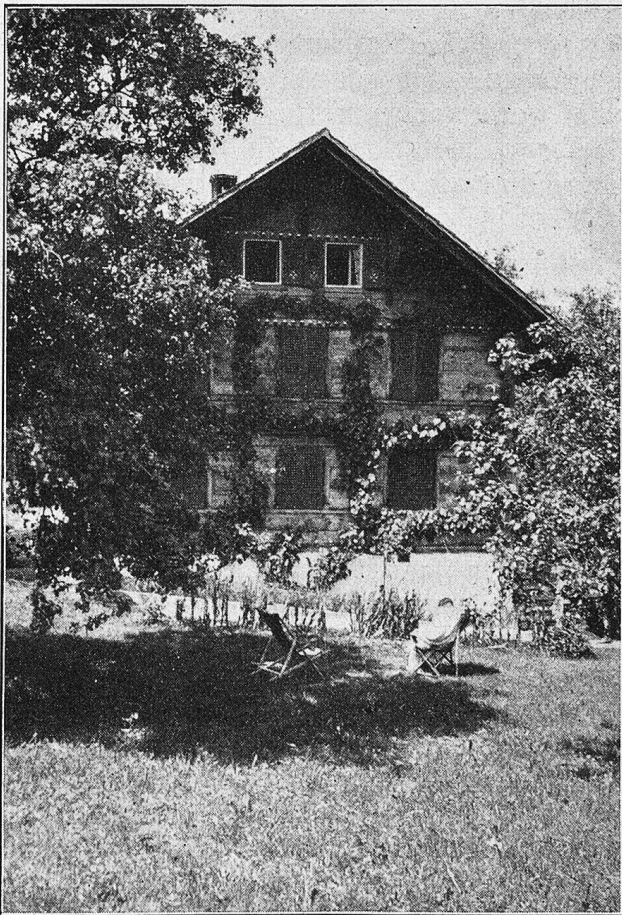
Wohnhaus eines Bürtmitgliedes.

Es hat herrliche Zeiten in Einigen, dem Wal- fahrtsort, der auch „zum Lust“ hieß, gegeben. Tänze, Schießen, große Kirchweihen, Steinstoßen, Schmausen verbreiteten Munterkeit und fröhliches Leben. Der Teufel wurde oftmals neidig ob der Lust, die sich hier kundgab, und ob dem frommen Sinn, den das Kirchlein pflanzte. Einmal, so wird noch heute erzählt, setzte sich der Teufel an den Fuß der Kanzel und schrieb alle auf, die während der Predigt eingeschlafen waren. Als das Pergament nicht reichte, nahm er es zwischen die Zähne und riß daran, um es zu verlängern.