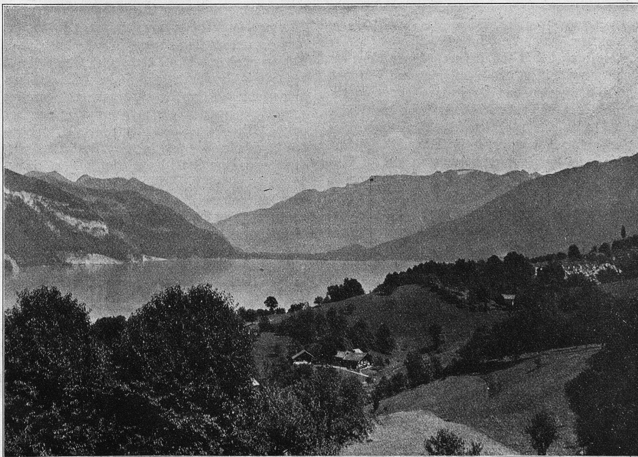
Blick vom Faulenseewald gegen das Bödeli. Links Brienzner Rothorn, rechts Schnige Platte.

Vieles erzählte man sich früher von den Herren von Strättligen, deren Stammschloß in Ruinen liegt, nicht weit von dem Kirchlein Einigen, mit dem es innig verknüpft war. Das Paradiesli — heute, da des Kirchleins würdige Einfachheit mit dem wunderbaren Blick auf den Thunersee und das Grün einer unvergleichlich schönen Landschaft wieder voll gewürdigt ist, wird uns die Wahrheit dieses Namens inne. Ein Schatz von unermeßlichem Reichtum, den niemand in Münze bezahlen könne, sei um das dem heiligen Michael geweihte Kirchlein gelegen, so erzählten sich in der Zeit des frühesten Christentums die Leute; denn alle Sünden würden hier vergeben. Der Arme finde hier, wovon er leben könne, der Reiche das Glück, das er anderwärts vergeblich suche, und vor allem Liebe, Freude, Lust; der Gerechte Gnade, der Besessene Erlösung. Michael,