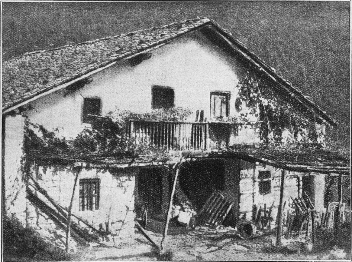
Typisches Bauernhaus im Baskenland; unten Stallung und Vorratsräume, oben Werkstätte und Balkon.

strie. Bilbao, das geistige und künstlerische Zentrum des Baskenlandes, ist zugleich der Mittelpunkt der spanischen Schwerindustrie mit seinen ausgedehnten Schiffswerften und den zahlreichen Gießereien. Trotz ihrer tiefen Religiosität verstehen die Basken auch das Leben zu genießen. Sie sind bekannt als tüchtige Esser und gute Köche. Die Volksnahrung des kleinen Mannes — der bacalao (Kabliau) — ist zum spanischen Nationalgericht geworden und mundet im Baskenlande wie eine Delikatesse. Noch heute glaubt die baskische Frau, die Milch habe ein besseres Aroma, wenn sie nicht gekocht, sondern mit heißen Steinen, die ins Gefäß gelegt, erwärmt werde. Die hohe musikalische Begabung und die Liebe zur Musik zeigt sich in den vielen Volksliedern, die zum Großteil in die älteste Zeit zurückreichen. Sie leben fort von Mund zu Mund und bilden den Widerschein der Volksseele in ihrem reinsten und tiefsten Gefühle. Sie erinnern stark an russische Musik in ihren schweremütigen Weisen. Der typische Vertreter der Volksmusik ist der „Txistulari“ — Trommler und Pfeifer in einer Person. Mit der Rechten schlägt er das Kalbsfell, und mit der Linken