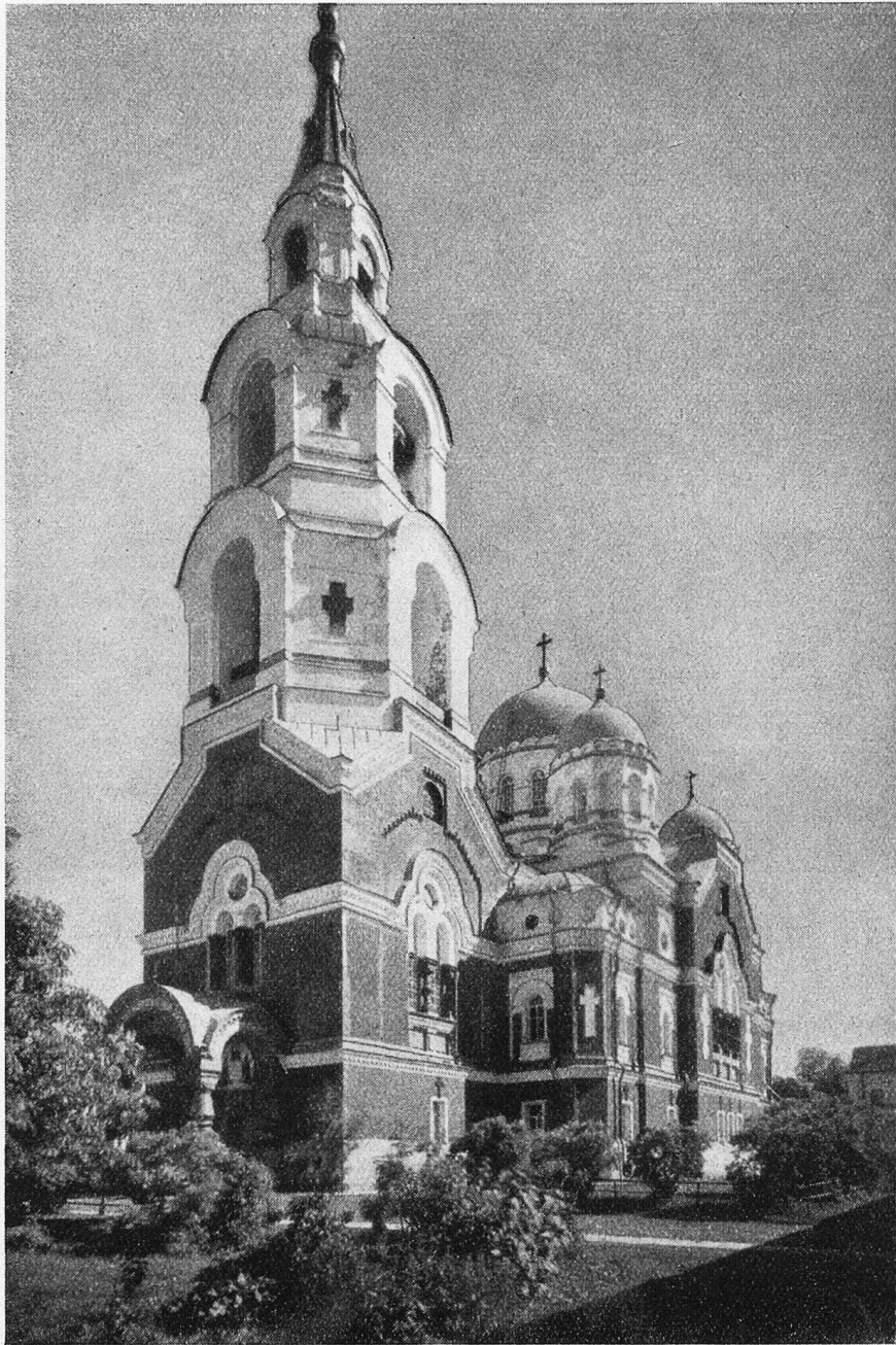
Die Kirche Christi in Valamo am Ladogasee (Finnland).

ein Zufall den Mönchen, die hier lebten, ihr Dasein, erhielt sich das Kloster und seine Vielzahl herrlicher Anlagen.