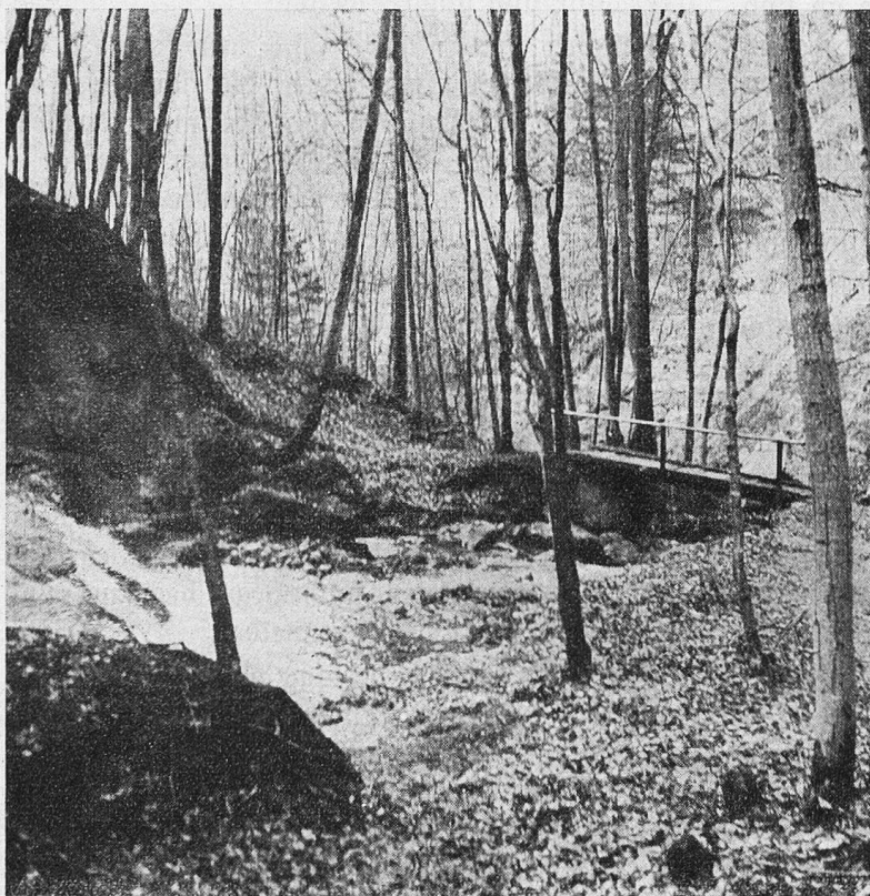
Partie aus dem Erlenbacher-Tobel.

So ließ ich meinen alten Plan, mich recht ausgiebig von der Frühlingssonne bescheinen zu lassen, zerflattern und stieg ins schmale Erlenbacher Tobel hinunter. Golden flimmerte es an den Stämmen der Bäume vorbei. Lustig tanzte die Sonne im Bach, bestrich die grünen Moospolster kühn und malevisch hingeworfener Steine und