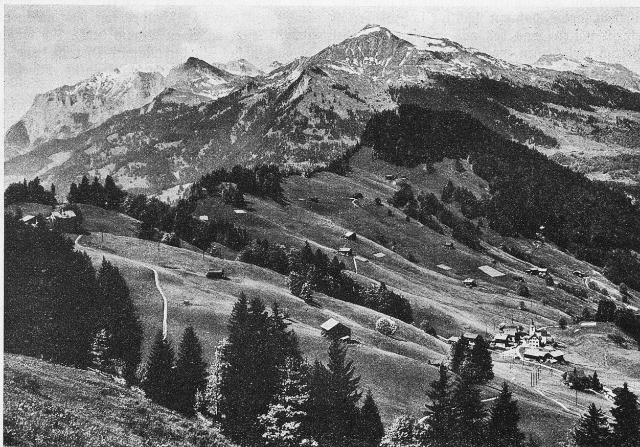
Valzeina mit Falknis und Vilan.

So schön und wohnlich sich das Prätigau mit seinen hübschen Dörfern jetzt präsentiert, früher muß es hier unwirtlich, urwaldgemäß ausgesehen haben. Es ist daher nicht verwunderlich, daß weder in prähistorischer noch in römischer Zeit nennenswerte Siedelungen bestanden haben. Der