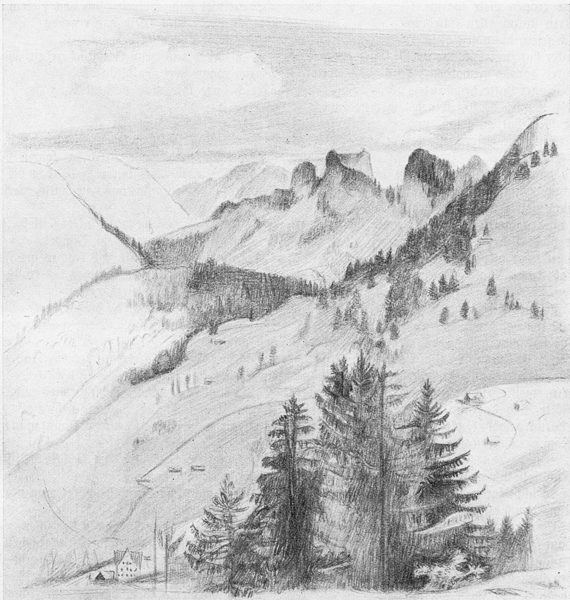
Im Toggenburg. Zeichnung von Theo Wiesmann.

sein Jagdkostüm und darüber seinen guten Sonntaganzug und zu guter Letzt noch drei Mäntel übereinander. So herausstaffiert wird die ganze Welt über ihn lachen.