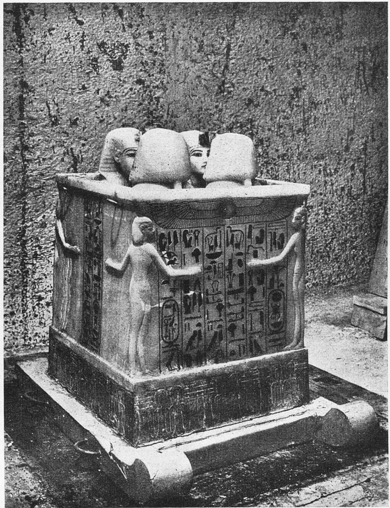
Der Alabasterschrein für die Eingeweide, geöffnet Man sieht auf den Vertiefungen, in denen die Eingeweide bestattet sind, die vier menschenköpfigen Deckel, die das Porträt des Königs zeigen

Etwas gab mir zu denken, und das war die Kleinheit der Öffnung im Vergleich zu den andern Talgräbern. Die Anlage war sicher die der 18. Dynastie. Konnte es das Grab eines Vornehmen sein, der hier mit der Erlaubnis des Königs bestattet war? War es ein Königsversteck, eine verborgene Stelle, wohin eine Mumie mit ihrer Ausrüstung zur Sicherheit gebracht worden war? Oder war es wirklich das Grab des Königs, das zu finden ich so viele Jahre verwandt hatte? Noch einmal untersuchte ich die Siegelabdrücke nach einem Anhaltspunkt, aber an dem bisher freigelegten Teil der Tür waren nur die schon erwähnten Siegel der Königstotenstadt klar zu lesen. Hätte ich gewußt, daß nur einige wenige Zentimeter tiefer ein vollkommen klarer und deut-