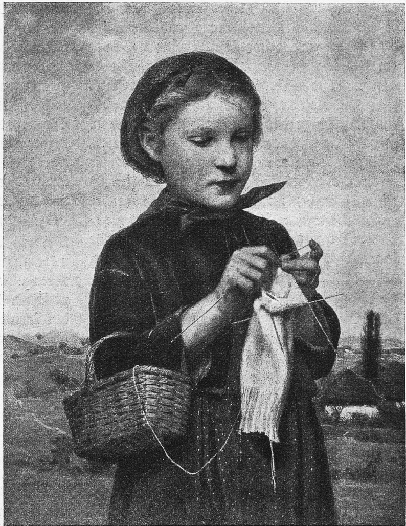
Albert Anker: Strickendes Mädchen