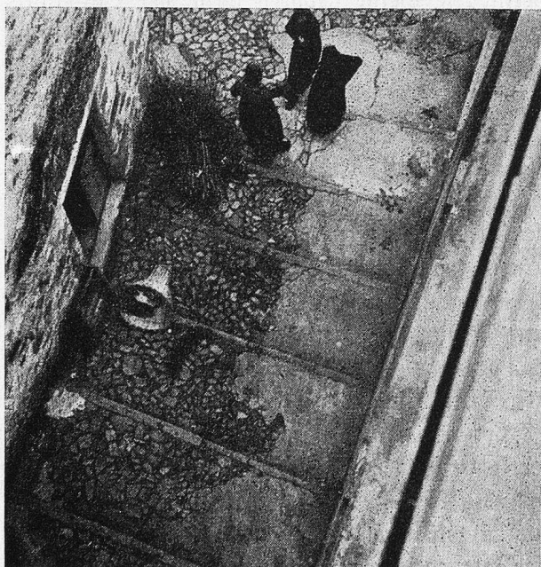
Auch im engen Tessiner Güsschen finden sie sich zu einem Schwütz

Wir wissen wohl, man kann auch den Werktag erleben. Etwa in einem bössartigen Frühling, wenn es zu regnen anfängt, wenn es regnet und regnet und nicht aufhören will, Tage und wochenlang nicht. Dann steigen die Seen, und die Bäche rauschen, und es ist kaum zu begreifen, daß wieder eine Trockenzeit kommen wird, in der die