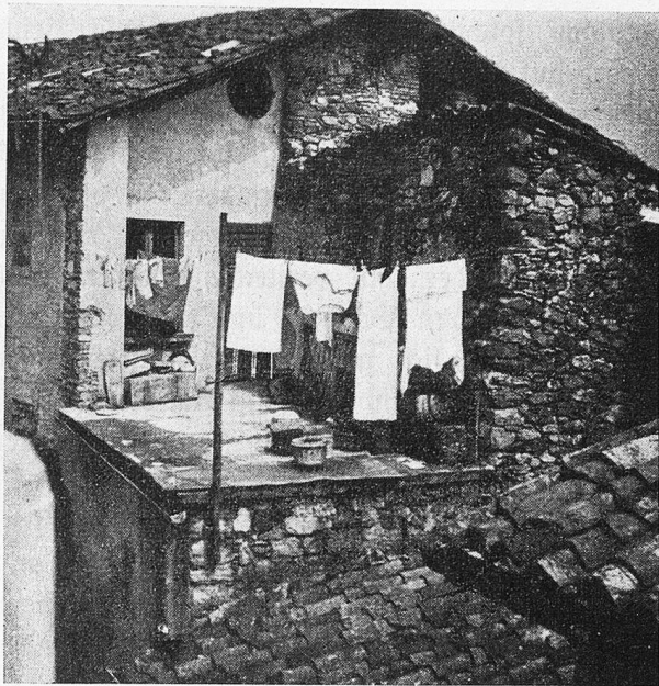
Sonniger Winkel in Moreote

In diesem zweiten Tessin habe ich ein paar köstliche Ferientage verbracht. Die Dörflein des Malcantone könnte man die himeliche Visitenkarte des Tessins heißen. Man hat seine Ruhe, und Wanderwege locken auf die Höhen und in verschwiegene Winkel. Plötzlich überraschen sie mit herrlichen Blicken ins Tal. Spiegelscherben eines Sees blitzen herauf, und immer weiter locken die Routen. Zuweilen rückt man von der Poststraße ab und klettert einen Pfad empor, an Hütten und Ställen vorbei, um oben wieder die große Straße zu kreuzen und schließlich an einem Punkte zu verharren, von dem man nicht leicht wieder los kommt. Das Auge springt auf, und man fragt sich: wo habe ich schon etwas Schöneres gefunden? Man muß sich lange besinnen. So