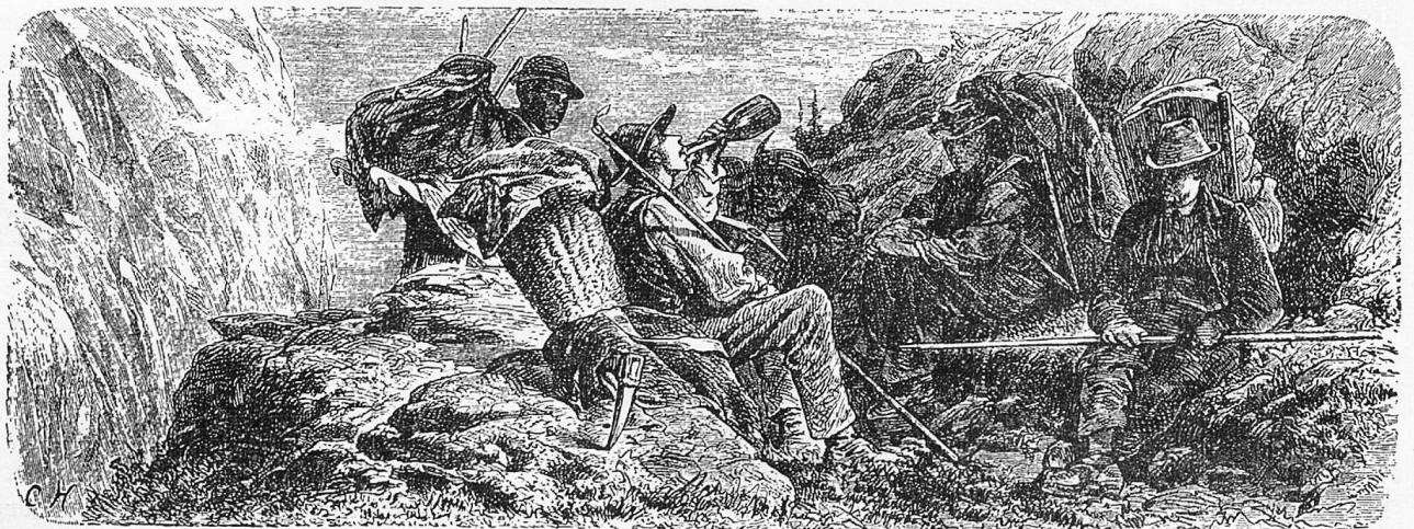
Kristallsuche auf der Grimsel

Unten an dem Berg sieht man eine Blatten oder grossen Stein, der über einen anderen Stein dahar hanget, unter welchem die eine Parthey der Crystall-Graberern ihre Wohnung und Auffenthalt haben. Von dannen steigt man den grausamen Berg hinauf, bis man mit grösster Mühe ohngeferd die Höhe der Crystall-Mine gewonnen, wo man dann zu einem alten Crystall- oder Strahl-Loch (dann so wird diese Materie von den Einwohnern und Land-Leuth genennet) kommet, an welchem ihro viel in die 7. Jahr vergebens (weil sie an denen unrechten Orthen angesetzt) gearbeitet. Von dannen hat man noch in die 200. Schritt alles der Fluhe nach durch einen entsetzlichen Weg und in erstaunlicher Gefahr zu gehen, da man auff der rechten Hand die Fluhe in ungemainer Höhe, auff der Lincken aber ein grausames Precipice (Abgrund) neben sich, anbey einen abhaltenden und kaum so breiten Weg hat, dass ohne die unterwegs in die Fluhe geschlagenen grossen eisernen Nägel es allerdings unmöglich fallen würde, dahin zu kommen. So muss man, um mit grossem Grausen zu dem Loch gekom-