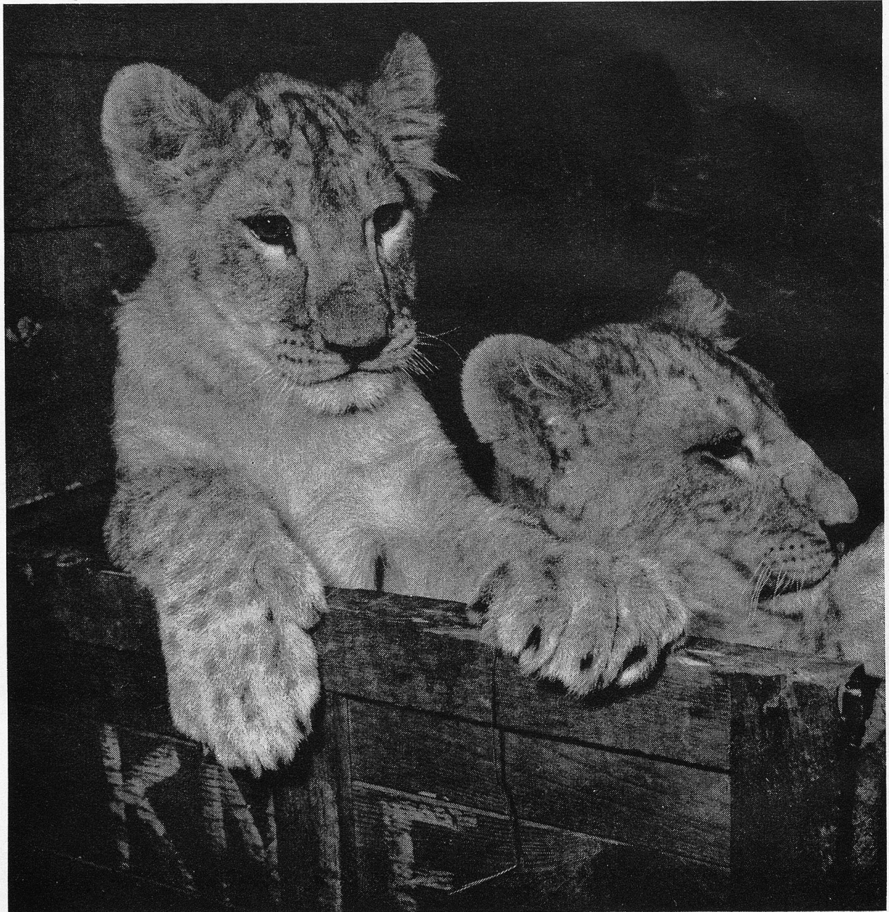
Die jüngste Generation