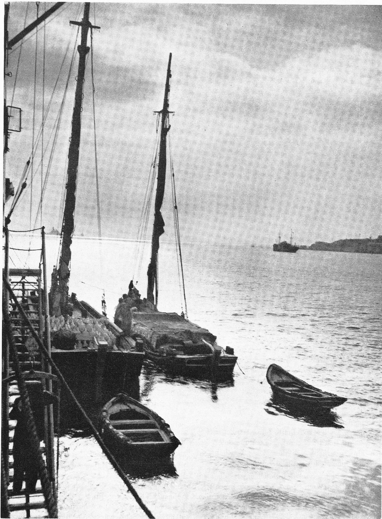
Schönes Portugal: Lissabon — Abend auf dem Tejo