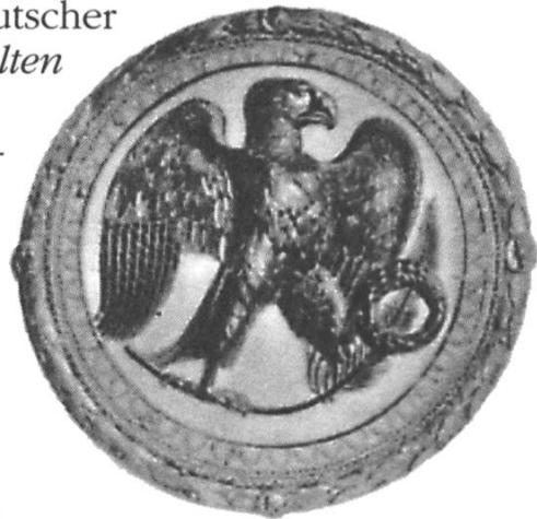
Adlerkamee (um 40 n. Chr.) (Kamee = Halbedelstein mit erhaben herausgearbeiteter figürlicher Darstellung)

Sie führten Kaiserszeichen, wie man in Fenstern findt,