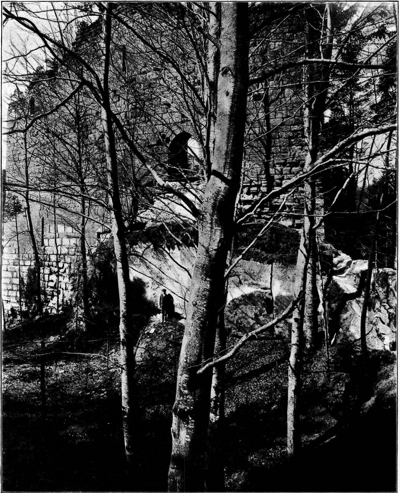
Hauptburg, Südostfront.