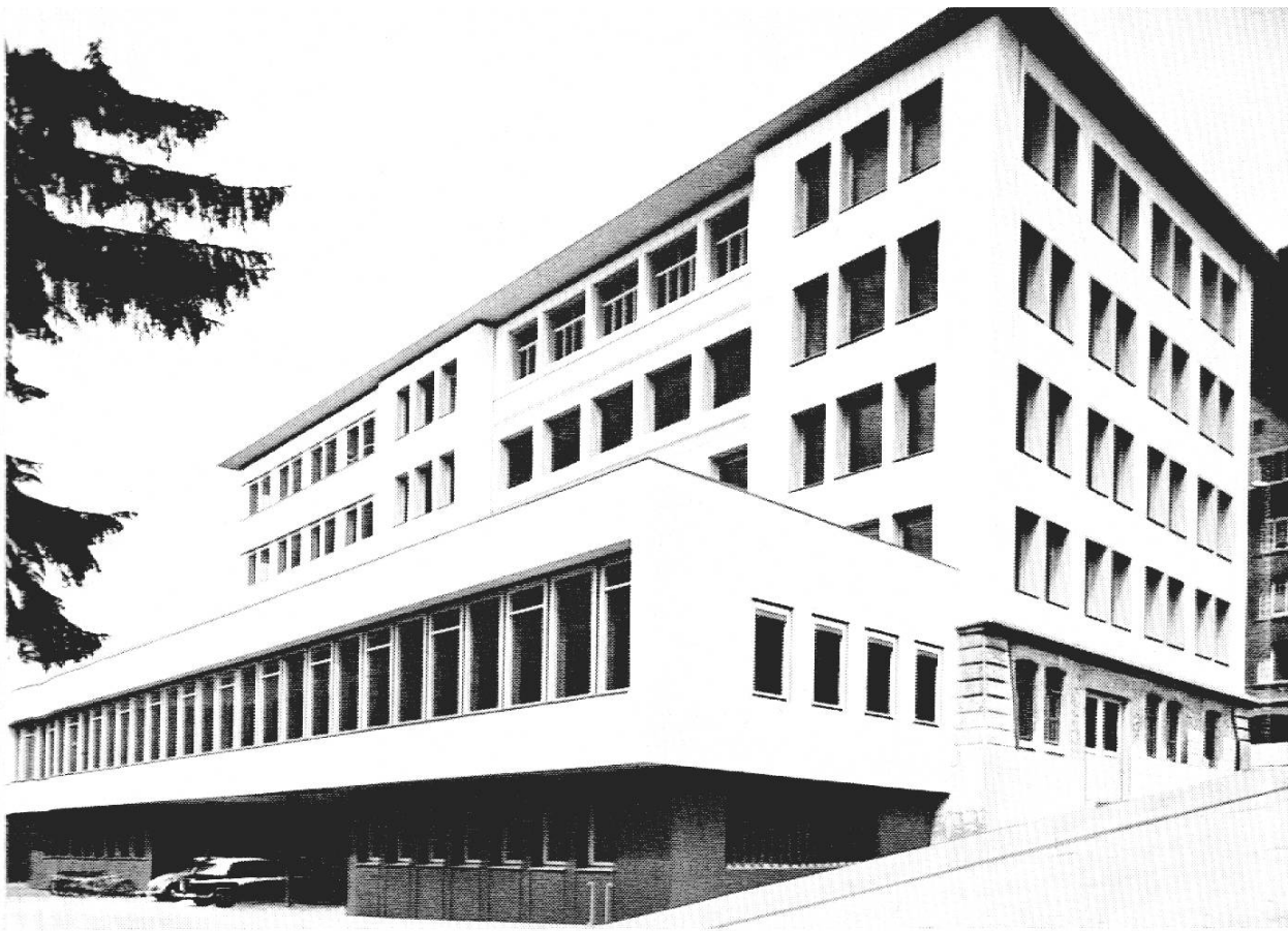
Le Technicum cantonal de Saint-Imier