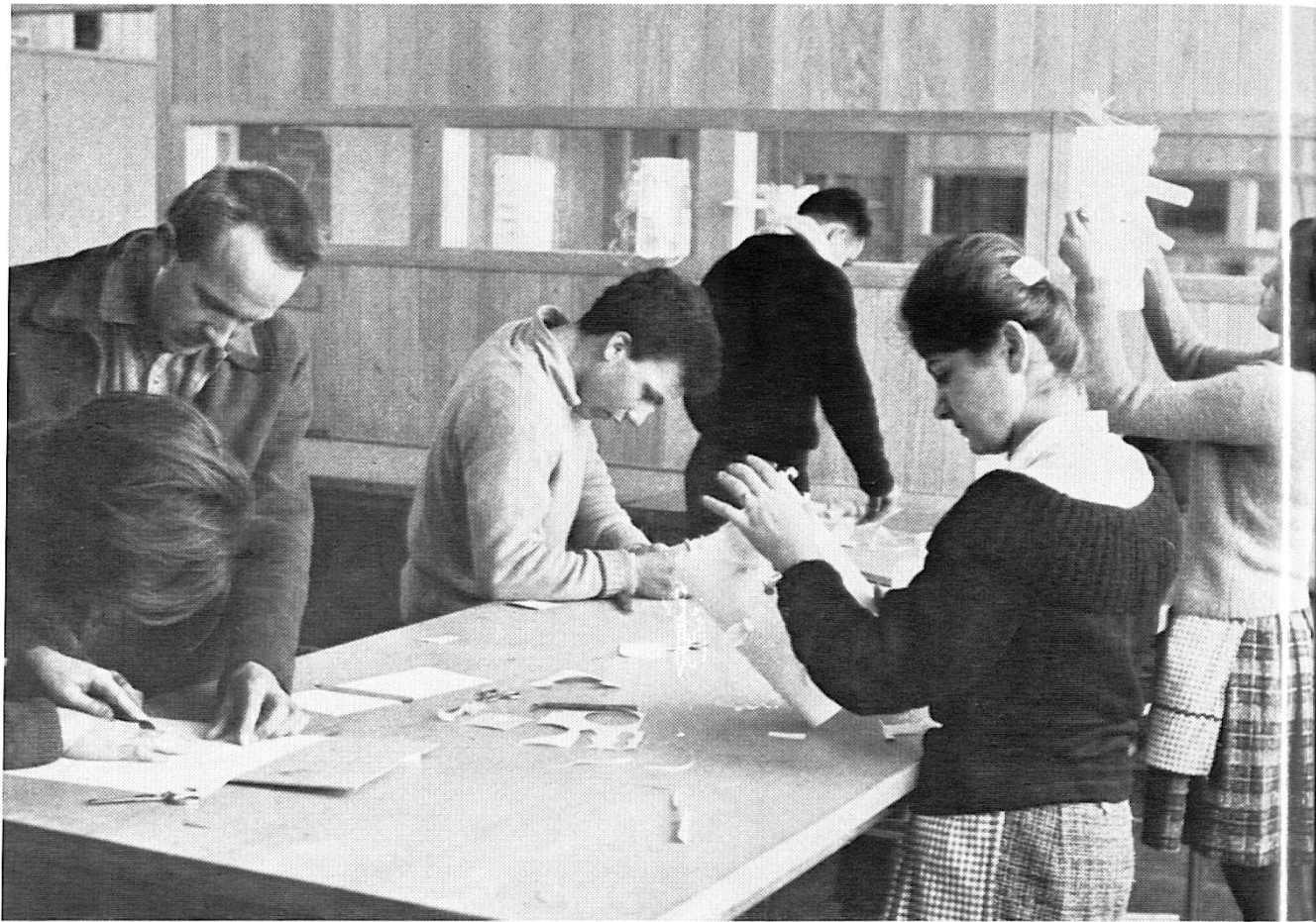
Travaux manuels à l'atelier de l'école secondaire.