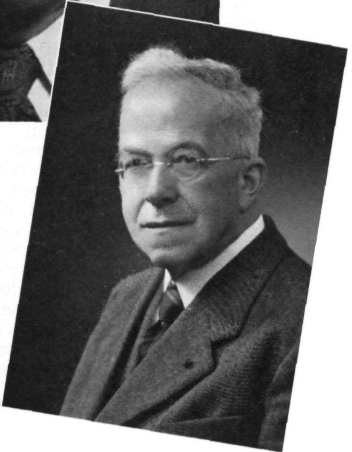
Regierungsrat Eugen Preisig, Herisau