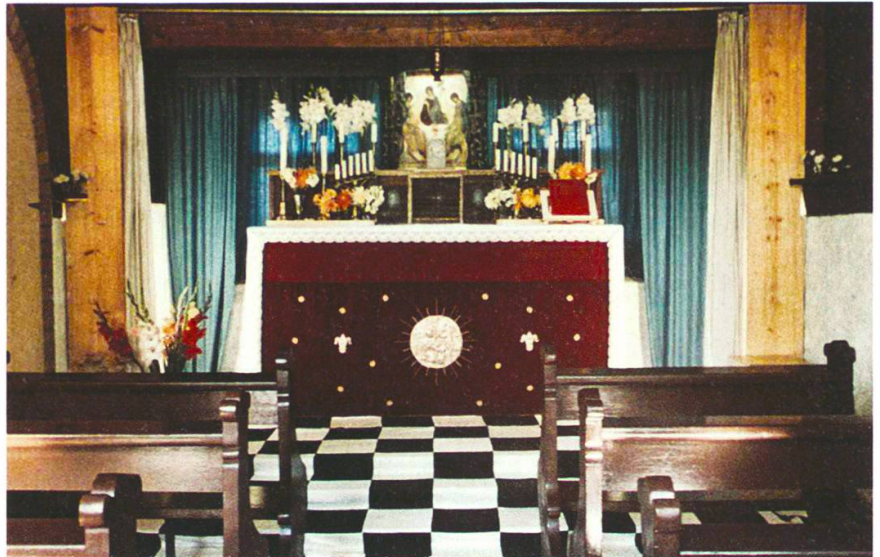
Kapelle in der Abtei Thelema, ohne Datum, abgebrochen im Jahr 2008.