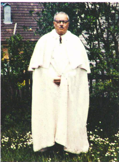
Festlicher Empfang für Dr. Gabriel Montenegro (1907–1969) aus Argentinien, 1965.