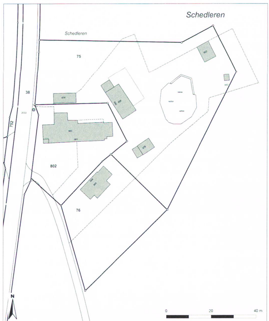
Die Liegenschaften auf Schedlern, Stein (AR), 2011.

Betrieb gewesene Akzidenzdruckerei installiert: Damit hatte sich die Psychosophische Gesellschaft mitsamt Mobiliar, Ritualgegenständen und Idealen definitiv im ausserrhodischen Stein in ihrer Abtei Thelema, zwischenzeitlich auch Komturei genannt, eingerichtet.