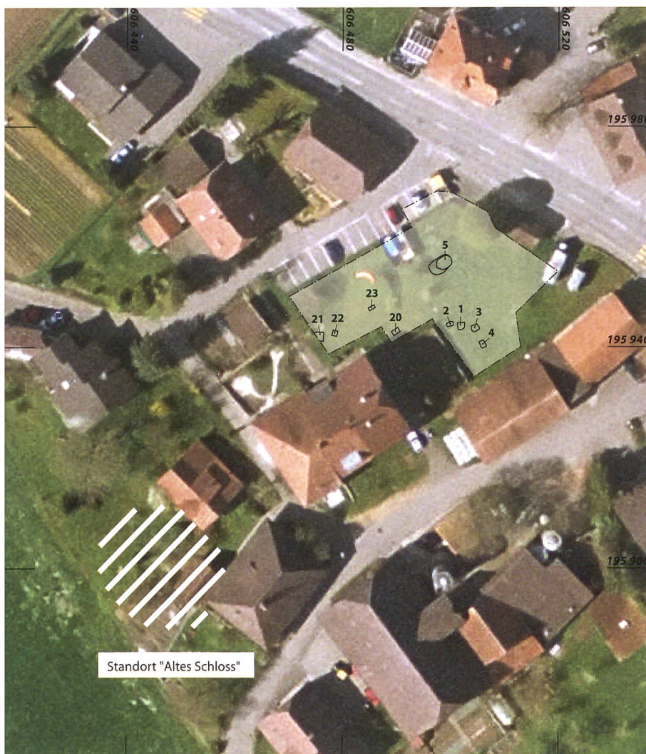
Abb. 1: Allmendingen, Kienermätteli. Untersuchungsfläche mit den Gruben 1 bis 5 und 20 bis 23. M. 1:1000.

In der untersuchten Fläche konnten 9 Gruben dokumentiert werden (Abb. 1). Die vier westlichen Strukturen 20–23 lieferten Keramik und Kleinfunde des 18. bis 20. Jahrhunderts (Abb. 2) und gehören zu neuzeitlichen Bauernhöfen. Von den vier östlichen Gruben sind vor allem zwei erwähnenswert. Die quadratische Brandgrube 1 mit einer Seitenlänge von 1,35 m war noch 20 cm tief erhalten und wies stark verbrannte, verzierte Seitenwände und eine brandgerötete Sohle auf. Die Einfüllung enthielt viel Holzkohle und verbrannte, hitzesprenge Geröllsteine (Abb. 3). Es muss sich hier um eine Feuerstelle oder Ofenkonstruktion handeln.