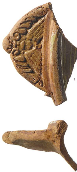
Abb. 2: Allmendingen, Kie- nerrmätteli. Randscherbe mit gemodeltem Griffappen aus dem 18. Jahrhundert. M. 1:2.

Flechtzäunen säumen die beiden Längsseiten der Grube. An der westlichen Schmalseite konnten im Abstand von 0,2 m beidseits des Firstpfostens ebenfalls zwei kleine Pfostenlöcher beobachtet werden. Im Osten liegen die Enden der beiden Konstruktionen direkt übereinander, so dass die Zugehörigkeit der Löcher nicht eindeutig zu klären ist. Hüttenlehmfragmente in der Einfüllung könnten vom Lehmverstrich