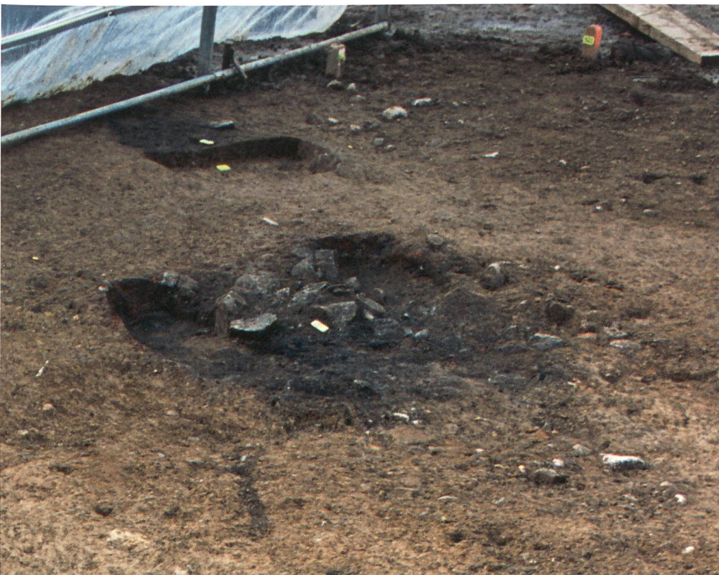
Abb. 3: Allmendingen, Kie- nerrmätteli. Im Vordergrund die Brandgrube 1 mit verzie- gelten Wänden und Teilen der Einfüllung aus Holzkohle und verbrannten Steinen. Hinten die Aschegrube, ein Teil der Einfüllung ist bereits abgebaut. Blick nach Westen.