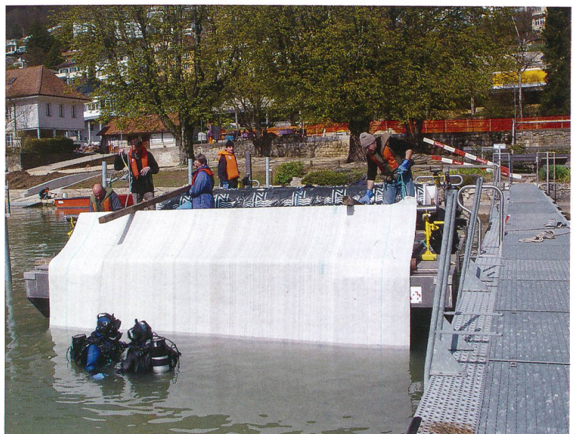
Abb. 6: Biel-Vingelz, Hafen. Schutz der jungsteinzeitlichen Siedlungsschichten im Hafenbereich durch die Verlegung von Geotextil.