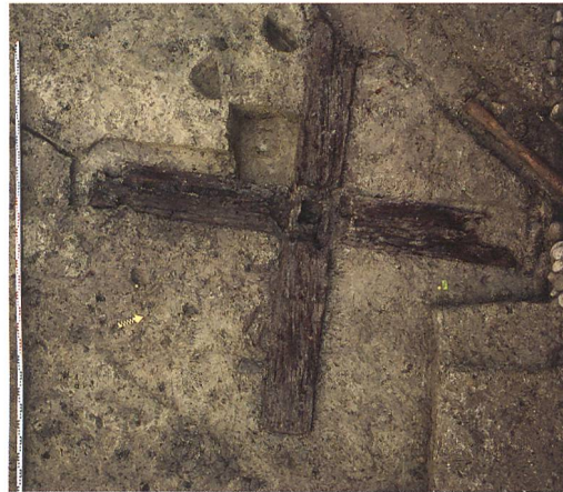
Abb. 2: Kallnach, Hinterfeld, römischer Gutshof. Das Holzkreuz aus zwei verblatteten Balken mit zentraler, quadratischer Öffnung zum Einsetzen eines Ständers. Leider erbrachte die dendrochronologische Datierung kein sicheres Ergebnis.

Als südlichen Hof bezeichnen wir hier die von Mauern umfasste, nicht direkt an das Gebäude anschliessende Fläche (A). Bisher kennen wir davon weder die gesamte Ausdehnung noch den genauen Grundriss. Als Teile der Begrenzung sehen wir die Mauern (83), (63) und (131). Mauer (63) bildet nur in der Westhälfte von (A) die nördliche Begrenzung. Mauer (131) läuft nordwärts über diese Flucht hinaus und könnte mit Mauer (192) einen Abschluss bilden. Benutzungsniveaus mit Spuren einer Garten- oder Parkgestaltung waren im Hof (A) nicht erhalten. Die Hoffläche wird von einem Mauerausbruchgraben (128) und verschiedenen Drainagegräben durchzogen, die vor dem Bau der Hofmauern angelegt worden sind. Dicht vor der Mauer (63) war ein Kreuz aus Tannenholz (85) horizontal in die Bauplanie eingetieft (Abb. 2). Es dürfte sich um den Fuss einer Bauinstallation, zum Beispiel eines Baugerüsts, einer Hebevorrichtung oder gar eines Vermessungsgerätes handeln.