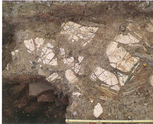
Abb. 7: Kallnach, Hinterfeld, römischer Gutshof. Bemalter Verputz in Fundlage. Er stammt vermutlich von der Decke der porticus (3).

Auf dem untersuchten Areal fanden sich drei gemauerte Kanäle, die das Abwasser aus dem Badetrakt und aus anderen Teilen der Villa abführten (vgl. Abb. 3). Ihre Wände waren teils mit Terrazzomörtel verputzt, die Sohlen mit Hypokaust- oder Dachziegeln belegt. Der grösste Kanal hatte eine lichte Weite von 60 × 100 cm. Kanal (264) führte leicht schräg, dicht ausserhalb von Raum 4 vorbei (Abb. 8) und mündete etwa 10 m südlich der Gebäudefront in den Ost-West verlaufenden Kanal (342). Die Anbauten an der Aussenfront von Mauer (193) sowie die Hofmauern entstanden nach dem Kanalbau. Den Ansatz eines weiteren, nur einige Zentimeter tiefen Kanals (287) haben wir an der Südwestecke von Raum 3 erfasst. Eine dicht an der westlichen Grabungsgrenze in Kanal (342) mündende Rinne (372) dürfte das Endstück von (287) sein. Nebst Dachwasser könnte (287) auch das Abwasser