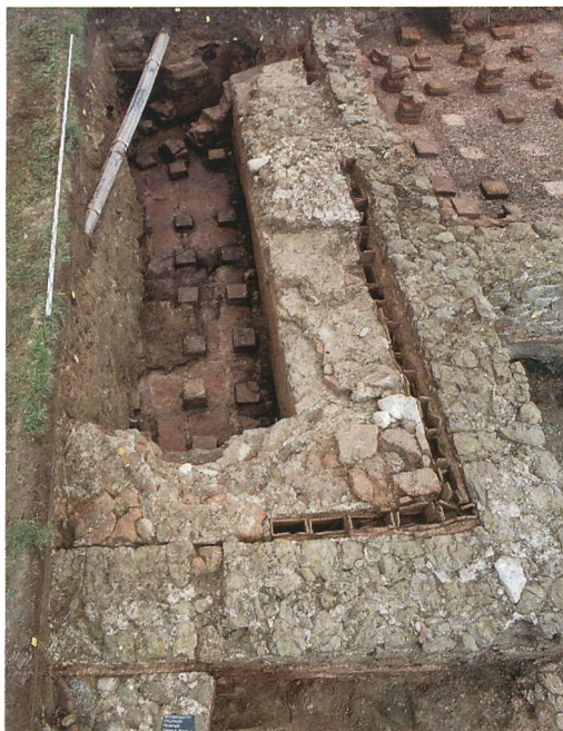
Abb. 4: Kallnach, Hinterfeld, römischer Gutshof. Raum 1 mit Resten der Hypokaustpfeiler, Beckenmauer und – als Trennung zur Gebäudemauer – Partien mit Tubulatur. Im Hintergrund der schräg in den Hypokaust ziehende Heizungskanal. Blick nach Norden.