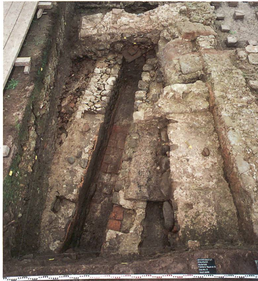
Abb. 8: Kallnach, Hinterfeld, römischer Gutshof. Der Kanal (264), ausgekleidet mit Terrazzomörtel und Hypokaustplatten. In den Kronen der Kanalwände Aussparungen für die Abdeckung. Das Podest im Vordergrund rechts könnte als Zugang zu (nicht nachgewiesenen) WC-Anlagen gedient haben, die über den angrenzenden Kanal gebaut waren. Im Hintergrund das praefurnium (243) zu Raum 4. Blick nach Süden.

der piscina 1 aufgenommen haben. Wenig vor der Gebäudefront führte eine Traufrinne (345) das Dachwasser in den Kanal (264).