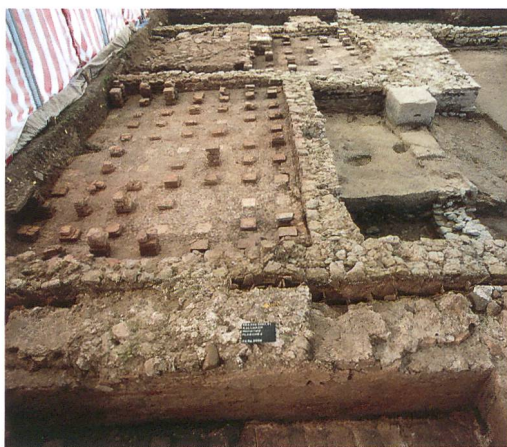
Abb. 5: Kallnach, Hinterfeld, römischer Gutshof. Im Vordergrund Raum 1. Der Unterboden des Hypokausts ist mit Dachziegeln belegt. Rechts die kleine Verbindungsöffnung zur Tubulatur zwischen den Mauern. An der Mauerfront Verputzreste mit Abdrücken von tubuli. Im Mittelgrund das caldarium Raum 2 und die porticus Raum 3 mit einer der beiden Säulenbasen. Im Hintergrund das frigidarium Raum 4 mit vorgebautem Erker. Blick nach Osten.

Das hypokaustierte Warmwasserbecken in Raum 1 ist ein Hinweis auf eine besonders luxuriöse Anlage, stand doch in kleineren Bädern das warme Wasser meist lediglich in einer Wanne zur Verfügung. Eine Besonderheit ist zudem die Hinterlüftung zwischen Gebäudemauern (169), (170) und Beckenmauer (180) durch die abschnittsweise Trennung mit tubuli (Hohlziegel) (Abb. 4). Diese waren durch eine Öffnung im untersten Bereich der Beckenmauer mit dem Hypokaust verbunden. Die Tubulatur an der Innenseite der Beckenmauer war nicht erhalten, liess sich aber anhand von Negativabdrücken im Verputz noch deutlich erkennen (Abb. 5).