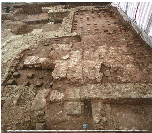
Abb. 6: Kallnach, Hinterfeld, römischer Gutshof. Blick von Osten über die Anlage. Im Vordergrund die Ostmauer (193) mit dem praefurnium zu Raum 4. Der Feuerkanal wurde sekundär eingebaut und nach Aufgabe des Hypokausts wieder zugemauert. In Raum 4 sind über dem verfüllten Hypokaust nur noch Spuren des eingezogenen Mörtelbodens erhalten.

In Raum 2, dessen Nordmauer dicht hinter der Grabungsgrenze folgen muss, gibt es keine Anzeichen verschiedener Bauphasen. Er könnte natürlich in verschiedenen Phasen der Thermenanlage unterschiedlich genutzt worden sein, als caldarium oder als tepidarium (lauwarmer Raum). Demgegenüber zeigte Raum 4 deutliche Funktionswechsel (Abb. 6). Das an seiner Ostwand erfasste praefurnium (243) wurde sekundär eingebaut. Offen bleibt, ob Raum 4 anfänglich nicht beheizt war, oder ob er ursprünglich von der Nordseite