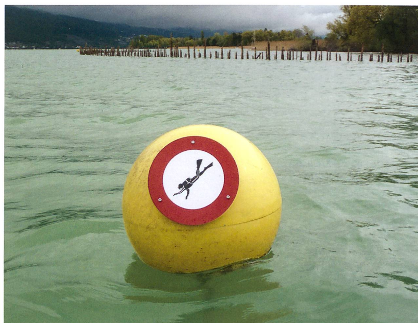
Abb. 3: Sutz-Lattrigen, Rütte. Zum Schutz der archäologischen Fundstelle musste zum ersten Mal in der Schweiz ein Tauchverbot aus denkmalpflegerischen Gründen erlassen werden.

Abb. 2: Sutz-Lattrigen, Rütte. Wind und Wellen erodieren vor allem bei starken Stürmen Teile der archäologischen Fundschichten.