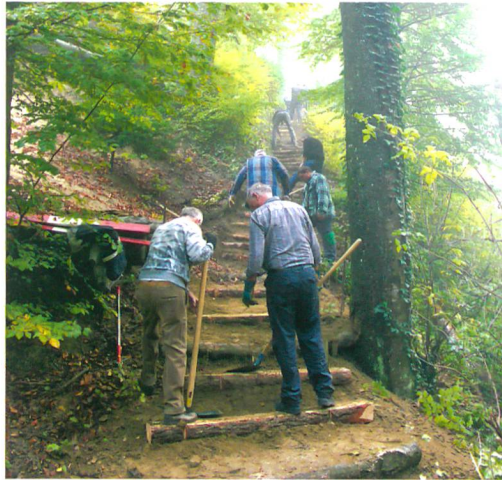
Abb. 3: Bellmund, Knebelburg. Die Rotarier im Einsatz im steilen Hang des Burghügels.

Unser herzlicher Dank für die gelungene Aktion geht an das Team des RCN mit seiner Verstärkung, an Hanspeter Luginbühl vom SFB und an die Gemeinde Bellmund.