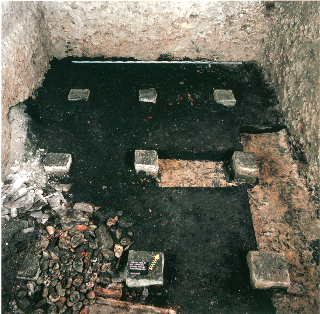
Abb. 5: Hilterfingen, Schloss Hünegge. Am Boden des Eiskellers ist die Schlackenschicht zu sehen, rechts und in der Bildmitte in Streifen freigelegt der Mörtelboden.

eigenständige Baumassnahme ohne schriftlich überliefertes Datum wäre jedoch auch denkbar.