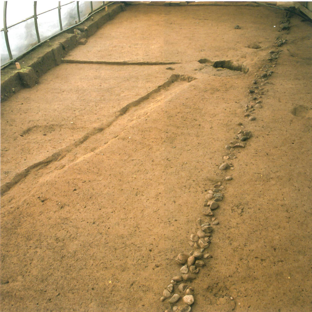
Abb. 4: Jegenstorf, Zuzwilstrasse. Die lange frühmittelalterliche Steinreihe 179 zeichnet sich im Silt deutlich ab. Es könnte sich um ein Grenzgräbchen oder einen Zaun handeln. Blick nach Westen.