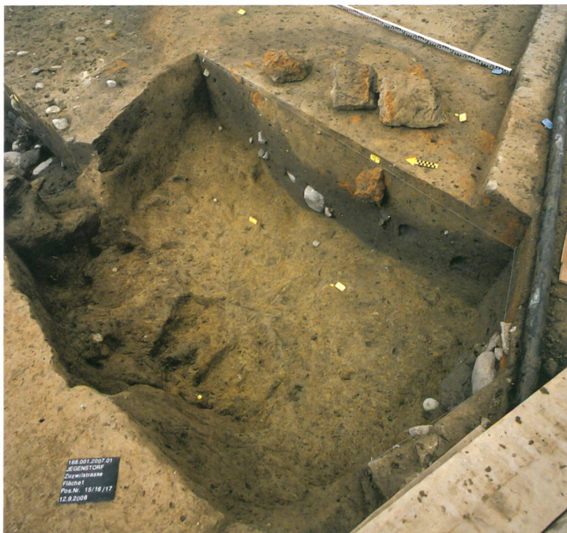
Abb. 6: Jegenstorf, Zuzwilstrasse, Grube 15. In der Einfüllung lagen grosse, nur auf einer Seite verbrannte Lehmziegel, die von einem Ofen stammen könnten. Einige davon liegen auf dem noch nicht ausgehobenen Ostteil der Grube. Blick nach Osten.