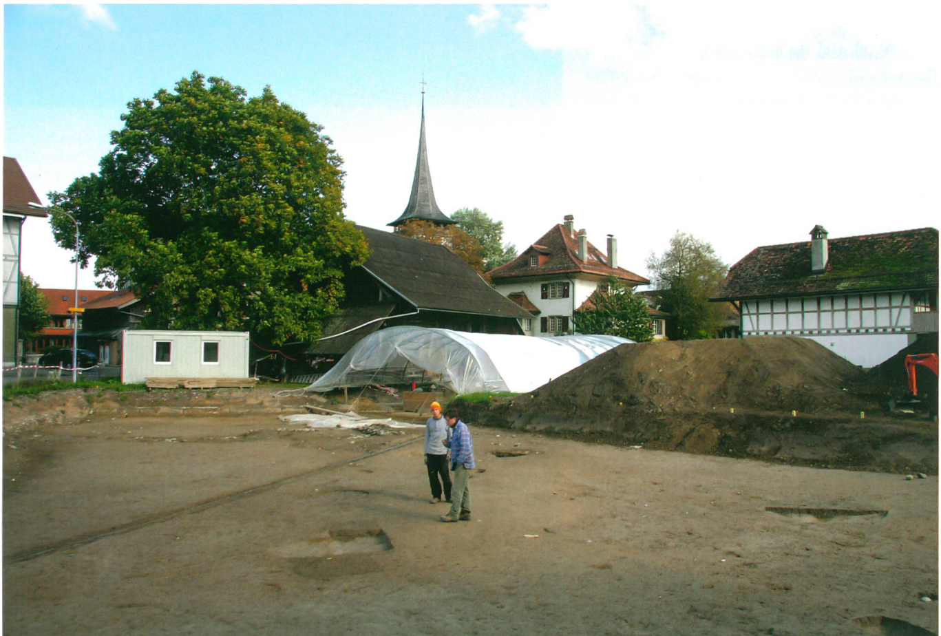
Abb. 1: Jegenstorf, Zuzwilstrasse. Grabungsfläche im Dorfzentrum, bei der Pfrundscheune. Blick nach Nordosten.

In der Grabung Kirchgasse (2006/2007) wurde erstmals ein Ausschnitt aus dem mittelalterlichen Dorf freigelegt: Die Grundrisse mehrerer Pfostenbauten und Grubenhäuser, sind über eine C14-Serie ins 8./9. Jahrhundert datiert.