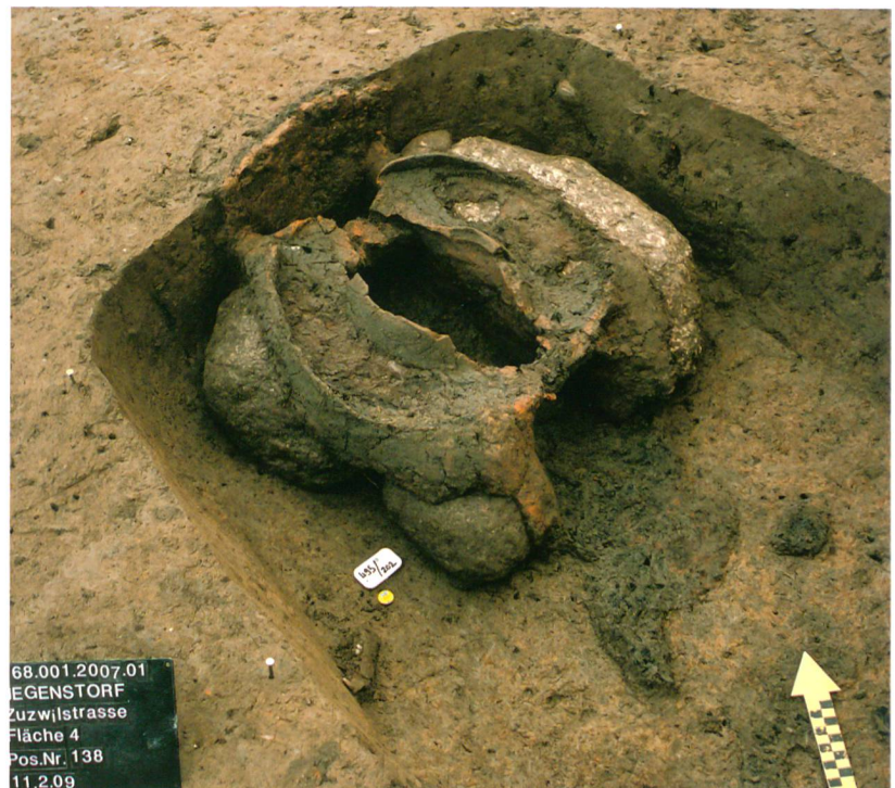
68.001.2007.01 JEGENSTORF Zuzwilstrasse Fläche 4 Pos.Nr. 138 11.2.09

Als Vorrats- oder Fassgrube ist wohl die kreisrunde Grube 253 anzusprechen, welche knapp 20 m südöstlich des Webkellers lag und einen Durchmesser von 1,7 m aufwies. Ein C14-Datum aus der Einfüllung datiert diese ebenfalls ins 11./12. Jahrhundert (Abb. 3). Einige grautonige Scherben bestätigen die mittelalterliche Datierung der Grubenfüllung. Je ein kleines neuzeitliches Glas- und Keramikfragment weisen aber auf neuzeitliche Störungen hin, wie sie in diesem Teil des Areals häufig anzutreffen sind.