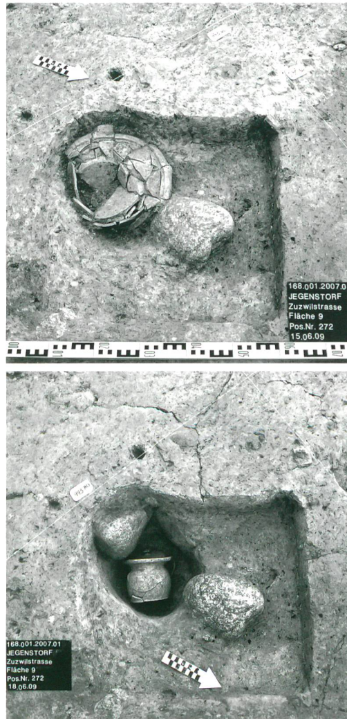
Abb. 8: Jegenstorf, Zuzwilstrasse. Grube mit auf dem Kopf liegender Deckschüssel und Nachgeburtstopf mit Deckel während der Freilegung, 2. Drittel 18. Jh.

Zusammenfassend lässt sich sagen, dass die Nutzung des Areals südwestlich der Kirche mindestens in römische, wahrscheinlich sogar in prähistorische Zeit zurückgeht. Ein frühmittelalterliches Gräbchen ist am ehesten als Hof- oder Dorfgrenze zu interpretieren. Seit dem Hochmittelalter wurde die Zone dann gewerblich genutzt, was besonders schön der Ofen zur Herstellung einer Glockenform und ein Webkeller belegen. In der Neuzeit handelt es sich schliesslich um einen rückwärtigen Grundstücks- oder Gartenbereich.