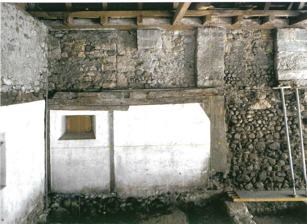
Abb. 6: Köniz, Schloss, Muhlernstrasse 15. Ansicht der Nordmauer. Die Zinnen aus Tuffsteinquadern wurden durch die modernen Sandsteinpfeiler gestört.