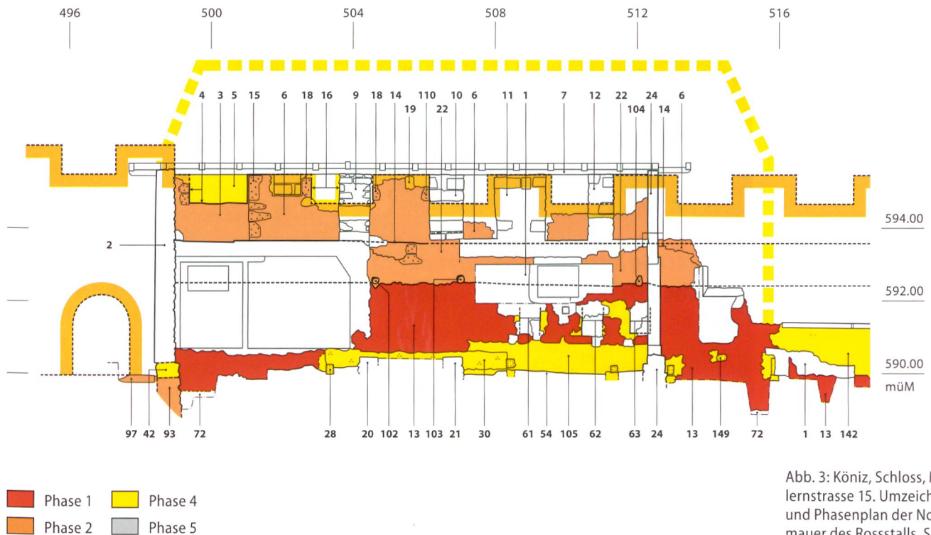
Abb. 3: Köniz, Schloss, Muhlenstrasse 15. Umzeichnung und Phasenplan der Nordmauer des Rossstalls, Südfassade. Phase 2 mit postuliertem Torturm in der Ringmauer. M. 1:150.