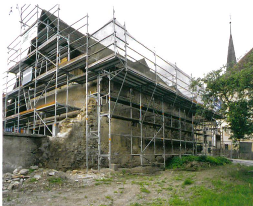
Abb. 2: Köniz, Schloss, Muhlernstrasse 15. Blick auf den Rossstall.

Das Schlossareal kann grob in drei Bereiche unterteilt werden, die bis ins 18./19. Jahrhundert auch separat ummauert waren: Erstens westseitig die Kirche mit dem Friedhof, zweitens nordseitig das eigentliche Schloss mit dem