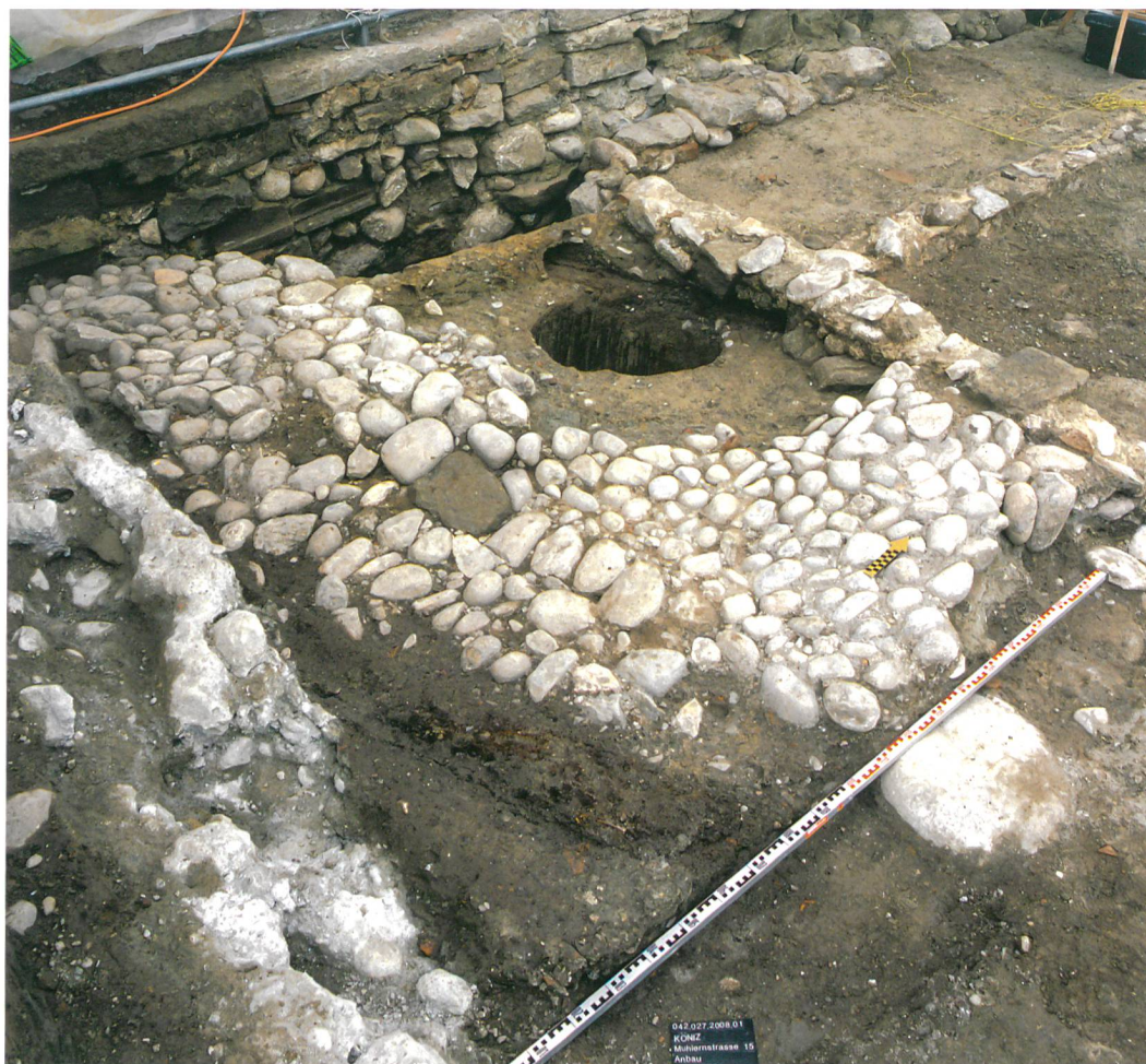
Abb. 7: Köniz, Schloss, Muhlernstrasse 15. Pflasterung und eingetieftes Regenwasserfass ausserhalb des Gebäudes des 18. Jahrhunderts.