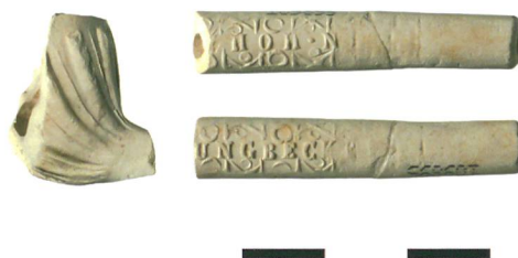
Fig. 5 : Sorvilier, La Rosière. Pipe en terre à fond rond; fourneau orné de côtes, tuyau marqué d'une double-inscription de part et d'autre du tuyau: (J)UNGBECK(ER) et IN ° HÖH(R), ce dernier moulé à l'envers. Les Jungbecker sont des artisans-pipiers localisés à Höhr dans le Westerwald D. Datation probable: premier quart du 19° siècle. Echelle 1: 1.

sage et de la fosse précisent nos connaissances de façon significative. Pour l'heure nous ignorons, faute d'un corpus archéologique suffisant, si cette technique de stabilisation par un entrelacs de branches est une pratique courante chez les chaufourniers. L'étude comparative intégrant des sites extérieurs à l'arc jurassien pourrait à l'avenir livrer une première réponse.