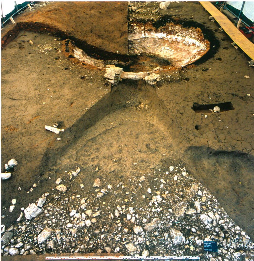
Fig. 2: Sorvilier, La Rosière. Vue d'ensemble du four à chaux: au premier plan, la fosse de travail triangulaire qui débouche sur la gueule du four, au second, le four circulaire bordé de trous de pieux. Vue vers le sud.

deux montants latéraux visibles sur la dalle de seuil; par contre, la hauteur de la gueule demeure inconnue. Autour du four, on distingue encore ponctuellement – et ce malgré le décapage mécanique de la surface! – un bourrelet de terre argileuse rubéfiée (17) de 40 à 50 cm de largeur qui s'appuie contre les montants latéraux de la gueule. Cet amas terreux constitue l'ultime vestige in situ du manteau argileux isolant qui couvrait la charge à calciner. En périphérie de ce bourrelet, à une distance de 60 cm environ, les fouilleurs ont retrouvé, sous l'épaisse couche de démolition rubéfiée, les vestiges de 18 poteaux (12) d'une dizaine de centimètres de diamètre chacun, plantés à intervalle régulier. Comme seuls trois-quarts de la surface ont été investigués, nous pouvons restituer un total probable de 23 pieux pour l'ensemble de la structure. A l'est de la gueule, un fragment de branche (18) entrelacée