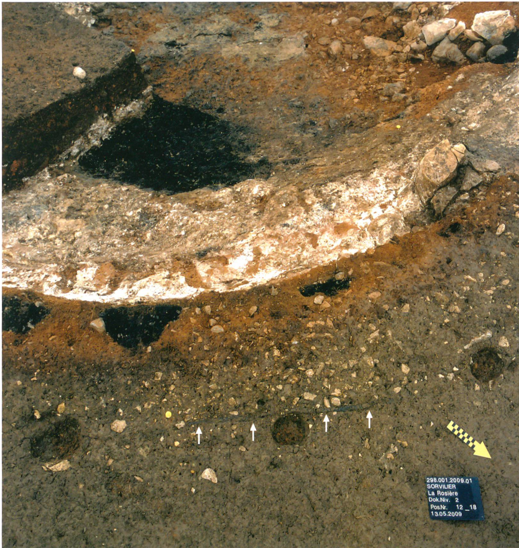
Fig. 4 : Sorvilier, La Rosière. Détail des restes de tressage mis en évidence entre trois poteaux. A l'arrière-plan le foyer du four.

sage et de la fosse précisent nos connaissances de façon significative. Pour l'heure nous ignorons, faute d'un corpus archéologique suffisant, si cette technique de stabilisation par un entrelacs de branches est une pratique courante chez les chaufourniers. L'étude comparative intégrant des sites extérieurs à l'arc jurassien pourrait à l'avenir livrer une première réponse.