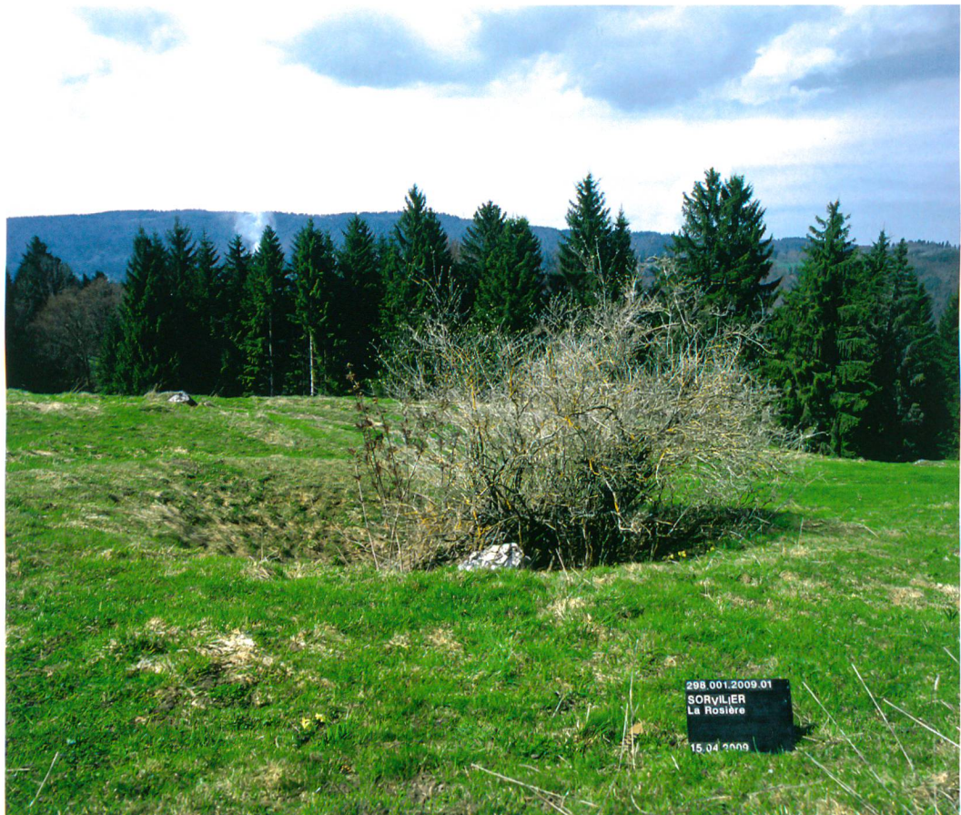
Fig. 1 : Sorvilier, La Rosière. Le four à chaux tel qu'il apparaissait dans son environnement naturel avant la fouille. Vue vers le nord.

semaines de mi-avril à fin mai 2009. L'expérience acquise ces dernières années lors de la fouille de plusieurs chauffours entre Moutier et Court a révélé une assez faible variabilité dans le mode de construction de ces structures. Aussi, nous sommes-nous concentrés sur des éléments constructifs discrets parfois plus difficiles à mettre en évidence, tel le boisage, le manteau argileux ou la fosse de travail. En outre, comme les fours à chaux offrent en général une grande symétrie axiale, nous avons pris le parti de vidanger la moitié de la structure au moyen d'une pelle mécanique. Après les relevés stratigraphiques d'usage, trois quarts du four ont été dégagés et documentés.