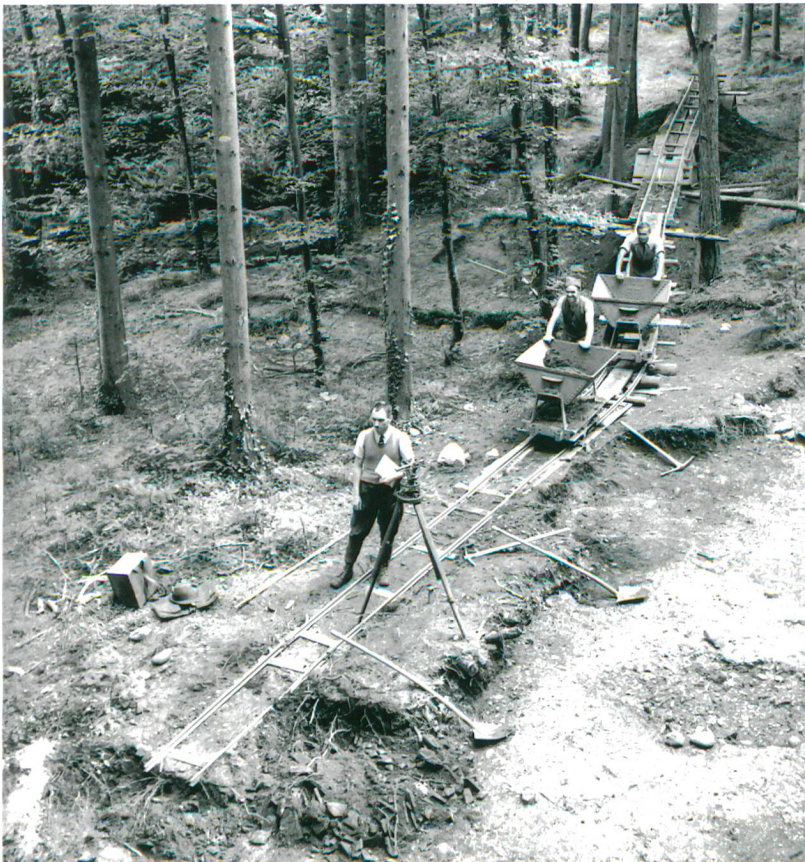
Abb. 1: Studen-Petinesca, Gumpboden. Ausgrabung 1937–1939 durch freiwillige Teilnehmer des «Technischen Arbeitsdienstes».

86 % des Waldes im unteren Seeland sind in öffentlicher Hand. Ausgerechnet der Studenberg jedoch ist stark parzellierter Privatwald (vgl. Abb. 5). Eine 1965 in Angriff genommene Waldzusammenlegung, von der sich der spätere Kantonsarchäologe Hans Grütter eine Verbesserung der Situation erhoffte, scheiterte. Das von der Temenosmauer des Tempelbezirks umschlossene Areal blieb auf neun private Parzellen verteilt. In den auf die Unterschutzstellung folgenden Jahrzehnten unternahm der ADB mehrere Versuche, den Tempelbezirk zu «verstaatlichen». Diese blieben jedoch alle erfolglos. Die Situation war und blieb für alle