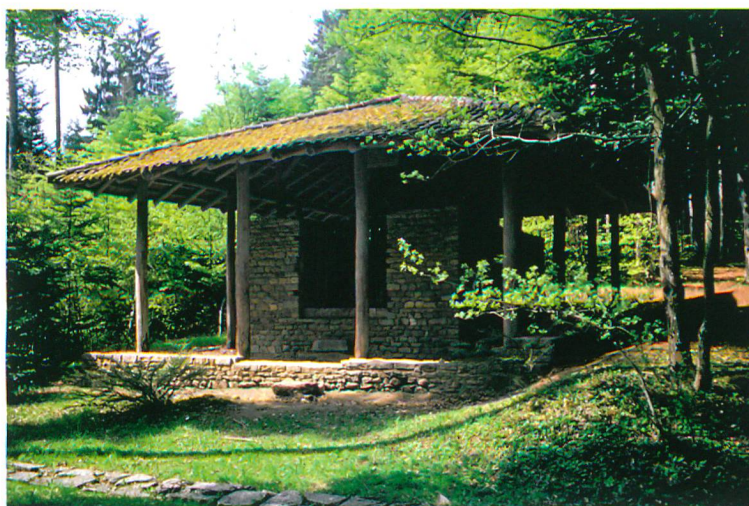
Abb. 3: Studen-Petinesca, Gumpboden. Tempel 2 im Wandel der Zeit. a: Befundsituation 1937. b: Idylle 1964, als die Anlage noch regelmässig durch die Stadtgärtnerei Biel unterhalten wurde. c: Rückbau des baufälligen Schutzdachs 2003. d: Die Ruine nach dem Rückbau des Schutzdachs 2003. e: Windfall im Winter 2004/05.