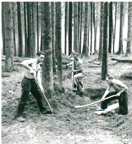
Abb. 2: Studen-Petinesca, Gumpboden. Ausgrabung 1937–1939. Handarbeit von A bis Z. Einer der rund 200 Sondierschnitte wird wieder eingefüllt.