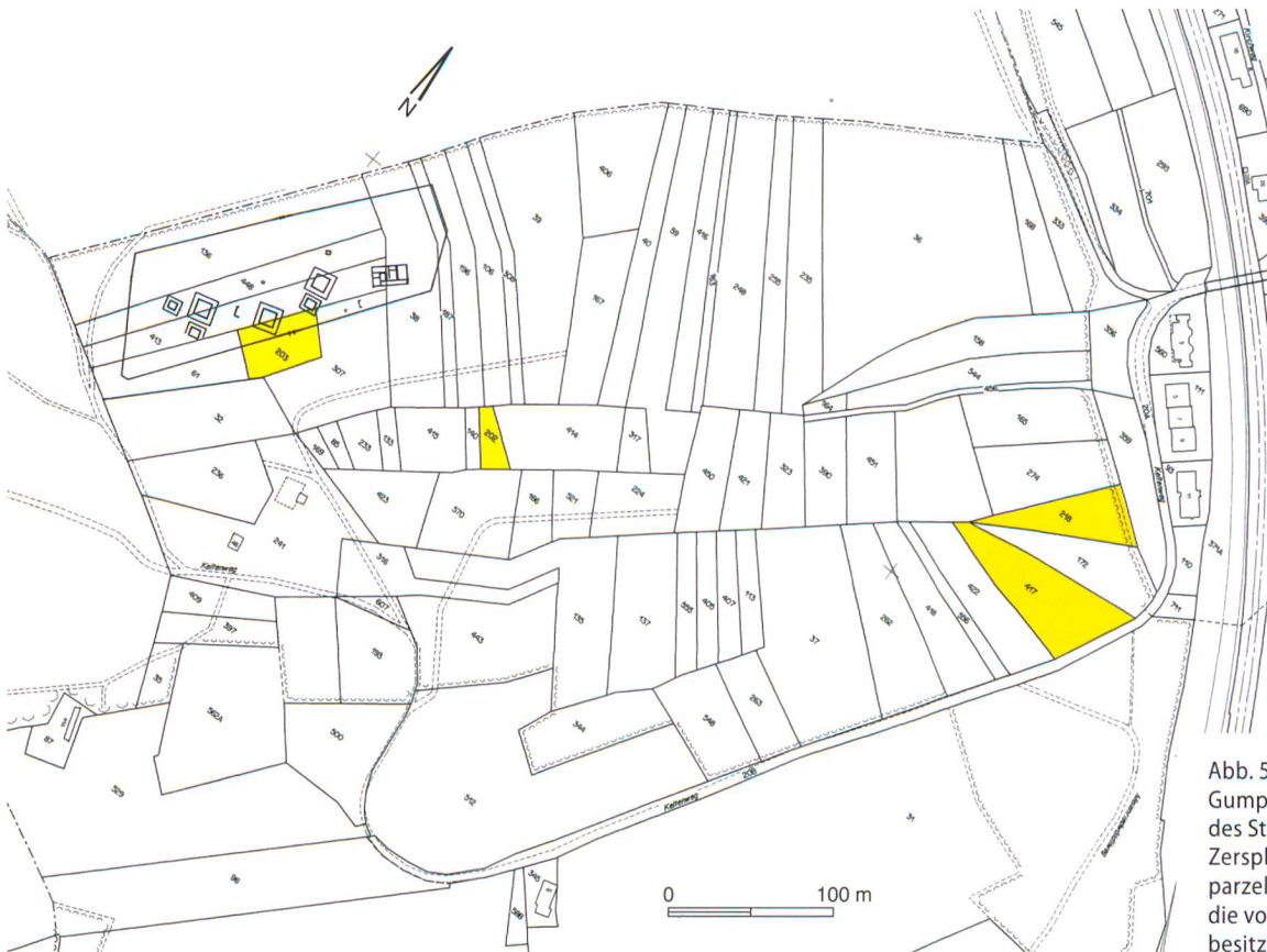
Abb. 5: Studen-Petinesca, Gumpboden. Katasterplan des Studenbergs mit seiner Zersplitterung in 76 Waldparzellen. Gelb die Parzellen, die vor dem Projekt in Staatsbesitz waren.