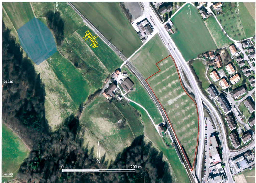
Abb. 1. Kehrsatz, Breitenacher. Sondierte Fläche und Fläche der Testgrabung (rot), Lage des römischen Gutshofs (gelb) und vermuteter Fundort des Depots von Bronzearmringen (blau). M. 1:5000.

Zur bisher ältesten Phase gehören zahlreiche Gruben, die verbrannte und hitzesprenge Steine sowie prähistorische Keramikfragmente und Gefässtiele enthielten (Abb. 2). Letztere lassen sich typologisch in die Frühbronzezeit datieren, was von zwei C14-Daten gestützt wird (Abb. 3). Ein verhältnismässig grosser Anteil der Keramik zeigt Einwirkungen von grosser Hitze. Diese könnten auf einen Dorfbrand hinweisen, belegen aber eher, dass wir uns im Werkareal einer Siedlung befinden.