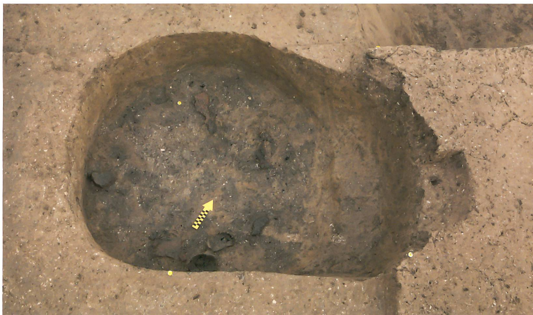
Abb. 2. Kehrsatz, Breitenacher. Grube mit gut erhaltenen Teilen von frühbronzezeitlichen Gefässen.

Direkt über der Schicht mit den bronzezeitlichen Strukturen lag auf einer Fläche von knapp 15 m 2 ein Kiesplatz mit teilweise erhaltener Originaloberfläche (Abb. 4). In den kompakten Kies eingelagert waren prähistorische Scherben, aber auch einzelne Eisenfragmente. Der Platz muss also jünger als die bronzezeitlichen Strukturen sein, liess sich aber bisher nicht eindeutig datieren. Neben einer eisenzeitlichen Siedlungsphase sind etwa auch ein Zusammenhang mit dem knapp 300 m nordwestlich gelegenen römischen Gutshof oder eine jüngere, mittelalterliche Nutzung des Areals denkbar.