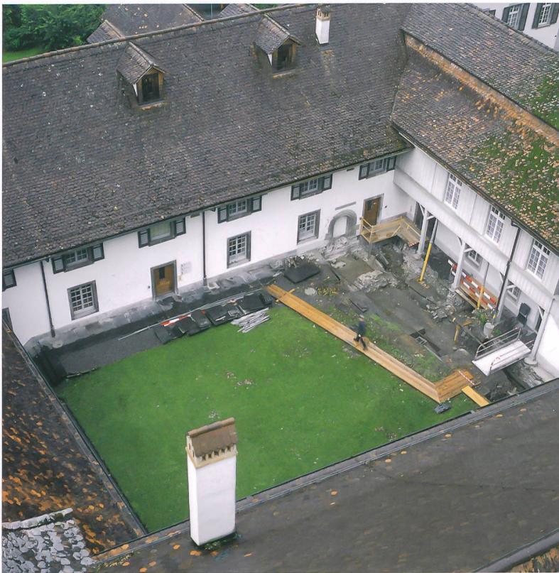
Abb. 1: Interlaken, Schloss. Blick in den spätgotischen Kreuzhof mit der Ausgrabung im Bereich des romanischen Konventflügels West. Im Hintergrund das Corps de Logis des barocken Landvogteischlosses. Blick nach Südwesten.

Das Augustiner-Chorherrenstift Unserer Lieben Frau in Interlaken wurde 1133 erstmals genannt, seit 1247 erscheinen Stiftsdamen in den Schriftquellen. Reiche Schenkungen und Käufe im 13. und 14. Jahrhundert machten das Doppelkloster zu einer der grössten Grundherrschaften im Berner Oberland. Es diente nach seiner Aufhebung im Jahr 1528 als Spital und Landvogteisitz und ist bis heute Regierungsstatthalteramt. Die ehemalige Klosterkirche beherbergt die evangelisch-reformierte Kirchgemeinde. Die Anlage weist heute einen Baubestand auf, der im Wesentlichen auf Um- und Ausbauten seit dem 15. Jahrhundert zurückgeht. Es gab in den letzten Jahrzehnten immer wieder punktuelle Bodeneingriffe und Bauuntersuchungen auf dem Schlossareal. Die archäologischen Untersuchungen der Jahre 2010 bis 2012, die durch umfang-