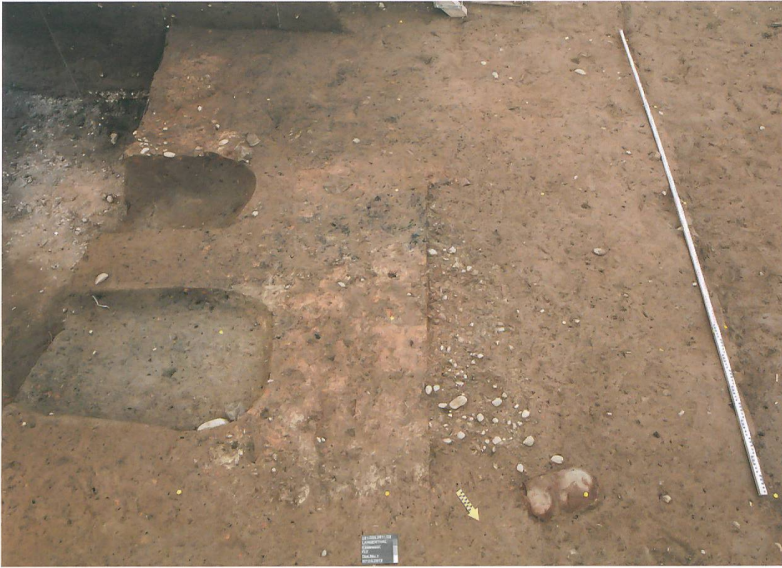
Abb. 3: Langenthal, Käsestrasse. Links: Zwei bereits ausgenommene Kadavergruben. Rechts im Vordergrund: Eine Feuerstelle mit Kiesunterlage. Im Hintergrund: Feuerstelle mit erhaltener Oberfläche. Blick nach Südwesten.