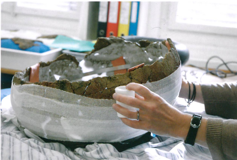
Abb. 5: Attiswil, Wiesenweg 15/17. Das mit selbsthaftender Binde umwickelte Gefäss, bevor es gedreht wird.

ben, was den extrem offenen Winkel des Unterteils erklären könnte. Da das Gefäss vermutlich zur kühlen Lagerung von Speisen gedient hat und deshalb in den Boden eingegraben war, war es bereits bei seinem Gebrauch gestützt (Ramstein 2014, S. 59). Bei diesem instabilen Bodenteil musste das anfängliche Konzept, nämlich das Gefäss vollständig aufzubauen, überdacht werden. Auch wurde das Objekt für die Zusammensetzung umgedreht und von oben nach unten aufgebaut (Abb. 3).