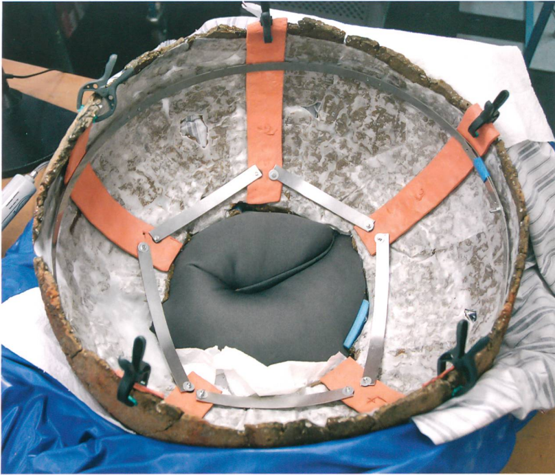
Abb. 4: Attiswil, Wiesenweg 15/17. Stützstruktur der Innenseite. Metallringe halten die Streifen aus luftgehärteter Knetmasse an der richtigen Stelle.

gewöhnlich getan wird. Ausserdem beeinträchtigte der sehr stumpfe Winkel zwischen Boden und Bauch von etwa 140° die Standfestigkeit des Objekts. Damit eine Chance besteht, dass der untere Teil die Last des oberen Teiles tragen kann, hätte um den Boden herum eine aufwendige Strebekonstruktion aufgebaut werden müssen. Gemäss Auskunft der Restauratorin Erika Berdelis, die experimentelle Archäologie praktiziert, wurde das Objekt seinerzeit aus mehreren Teilen hergestellt. Dies lassen auch die Bearbeitungsspuren des Töpfers vermuten. Das Gefäss muss sich schon bei seiner Herstellung unter dem Gewicht des oberen Teils abgesenkt ha-