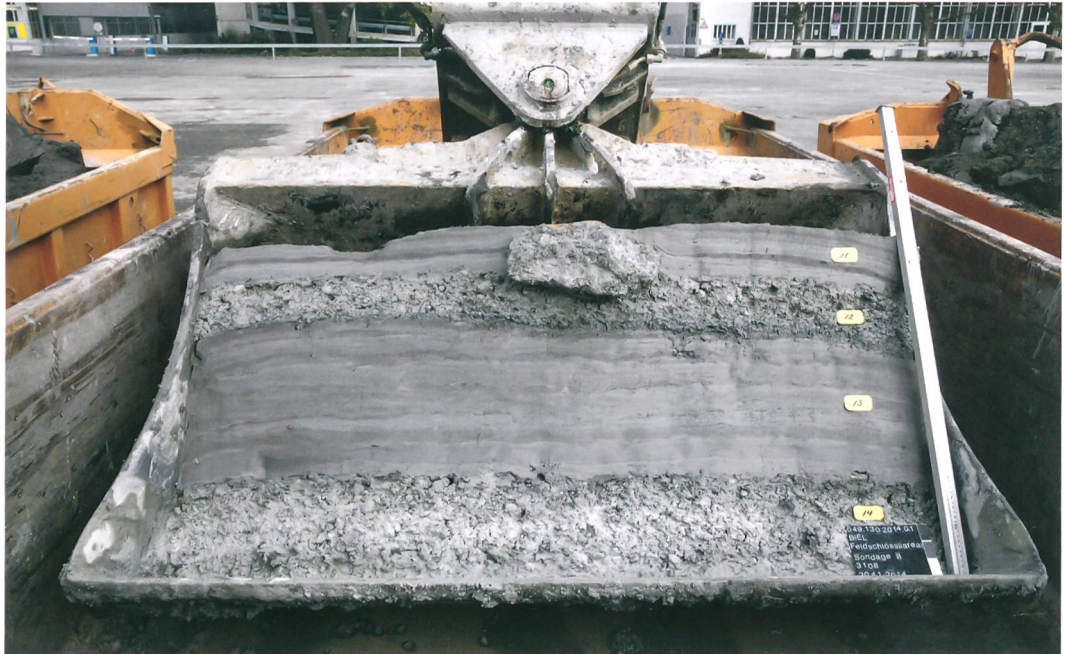
Abb. 4: Biel, Feldschlössli-areal. Baggerschaufel mit der archäologischen Fundschicht zwischen gebänderten Tonpaketen. Der grosse Bruchstein ist ein deutlicher Hinweis auf menschliche Aktivität.

noch in eingeschränktem Mass vorhanden. Alle stabileren Materialien wie Holz, Keramik, Knochen und Stein blieben aber erhalten. Wir sprechen in einem solchen Fall von einem Reduktionshorizont.