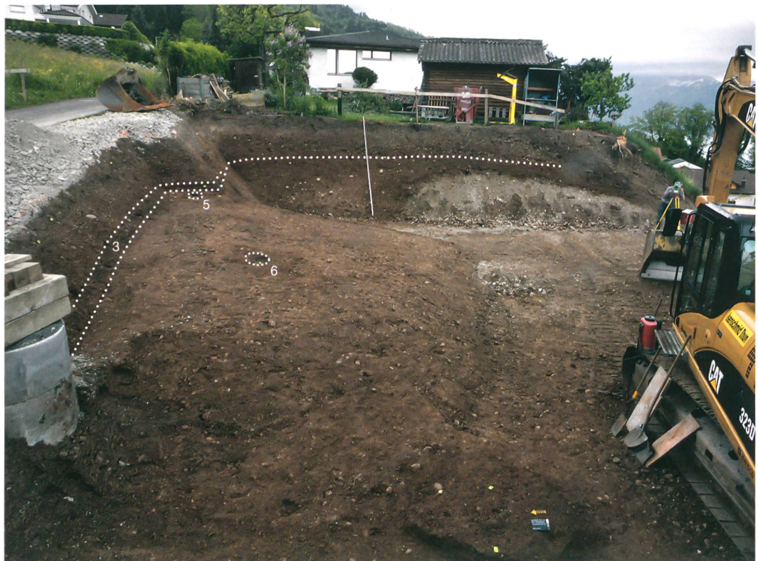
Abb. 2: Hilterfingen, Tannenbühlweg 4. Die Fundschicht 3 dehnte sich über die ganze Grabungsfläche aus. M. 1:500.

Abb. 1: Hilterfingen, Tannenbühlweg 4. Die Grabungsfläche nach dem Abbau der Fundschicht 3, die sich in den Profilen als dunkle Schicht erkennen lässt. Es zeichnen sich zwei Pfostengruben (5, 6) ab. Blick nach Osten.