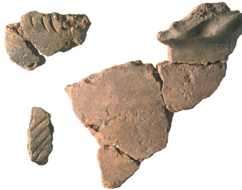
Abb. 3: Hilterfingen, Tannenbühlweg 4. Dekorationsvarianten an Gefässkeramik (Ind. 6, 17 und 18). M. 1:2.

Unter der Fundschiicht 3 zeichneten sich vor dem Nordprofil die beiden Pfostengruben 5 und 6 ab (Abb. 2). Ihre Durchmesser betragen 45 respektive 35 cm, ihr Abstand 4,5 m. Ob die Pfosten, die einst in diesen Gruben standen, eine Hauskonstruktion trugen, kann nicht belegt werden. Ihre Grösse und Abstände könnten dafür sprechen. Wahrscheinlich setzt sich die Konstruktion nach Norden bis unter den Tannenbühlweg fort und bleibt im Boden geschützt erhalten.