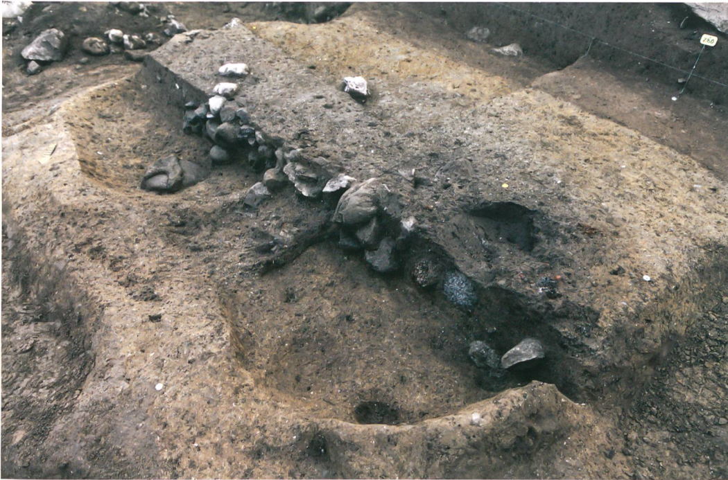
Abb. 3: Köniz, Chlywabere. Schnitt durch die Grube 262. Die verbrannten Lehmfragmente, vermutlich eines Kuppelofens, lagen in der Mulde im Vordergrund. Blick nach Süden.

Spuren, die auf ihre ursprüngliche Funktion hätten schliessen lassen, waren nicht erhalten. Die Abfälle belegen aber einen Werkplatz unbekannter Funktion in unmittelbarer Nähe. Unter der Grob- und Feinkeramik aus der Einfüllung findet sich ein Topf mit Buckel- und Ritzverzierung (Abb. 4), der Parallelen im Gräberfeld von Neftenbach ZH findet. Dieses wird in die frühe Spätbronzezeit datiert (13. Jh. v. Chr.). Die Pfostenstellungen und die Grube belegen eine Siedlungsphase, die anhand einer ersten Serie Radiokarbonanalysen an Holzkohlen in die Mittel- oder frühe Spätbronzezeit (15.–13. Jh. v. Chr.) datiert.