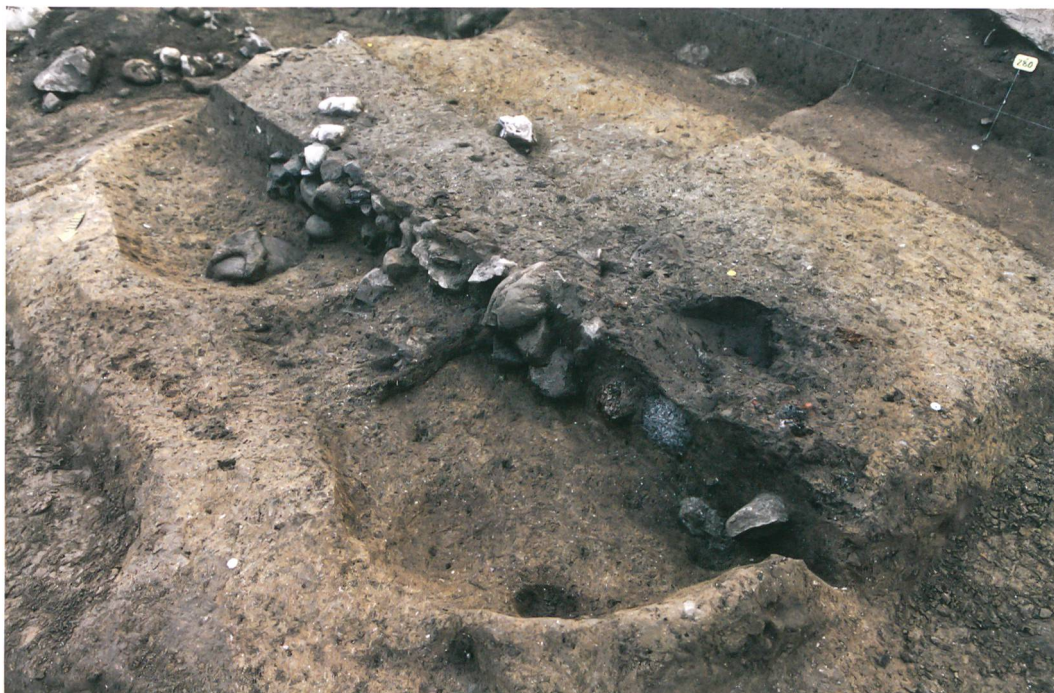
Abb. 3: Köniz, Chlywabere. Schnitt durch die Grube 262. Die verbrannten Lehmfragmente, vermutlich eines Kuppelofens, lagen in der Mulde im Vordergrund. Blick nach Süden.

Spuren, die auf ihre ursprüngliche Funktion hätten schliessen lassen, waren nicht erhalten. Die Abfälle belegen aber einen Werkplatz unbekannter Funktion in unmittelbarer Nähe. Unter der Grob- und Feinkeramik aus der Einfüllung findet sich ein Topf mit Buckel- und Ritzverzierung (Abb. 4), der Parallelen im Gräberfeld von Neftenbach ZH findet. Dieses wird in die frühe Spätbronzezeit datiert (13. Jh. v. Chr.). Die Pfostenstellungen und die Grube belegen eine Siedlungsphase, die anhand einer ersten Serie Radiokarbonanalysen an Holzkohlen in die Mittel- oder frühe Spätbronzezeit (15.–13. Jh. v. Chr.) datiert.