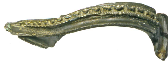
Abb. 9: Köniz, Chlywabere. Hülenspiralfibel mit Wellenlinienverzierung. M. 2:1.