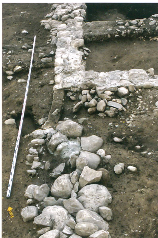
Abb. 6: Köniz, Chlywabere. Im Vordergrund das Fundament der Umfassungsmauer und dahinter die nordwestliche Gebäudeecke. Blick nach Nordosten.

Mauerwerks zeichnete sich das Negativ einer 3,35 m langen Schwelle ab (Abb. 7). Auf der Aussenseite des Raums diente eine mächtige Steinsetzung als Zugangsrampe. Der breite Eingang und die Rampe weisen das Gebäude als Wirtschafts- und nicht als Wohnbau aus.