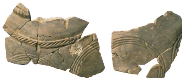
Abb. 4: Köniz, Chlywabere. Fragmente eines verzierten feinkeramischen Topfs der frühen Spätbronzezeit. M. 1:2.

In einer zweiten Phase wurde für den Bau des Gebäudes das Gelände leicht aufplaniert. Anschliessend wurden die beiden im Verband stehenden Mauern 207 und 227 erstellt. In einer nächsten Etappe folgte der Anbau der Mauern 204 und 205/206, sodass ein rechteckiger Raum von 9 \times 7,3 m mit einer Innenfläche von 54 \text{ m}^2