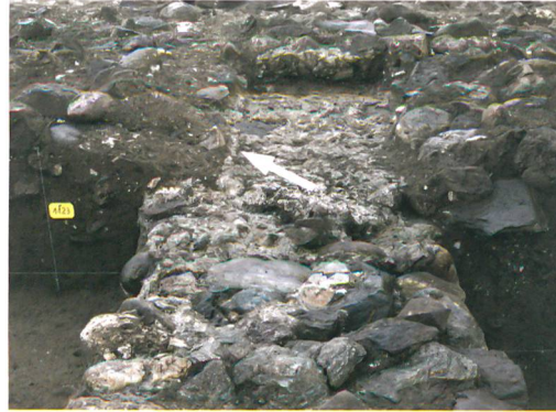
Abb. 7: Köniz, Chlywabere. Abdruck einer Schwelle (Pfeil) auf der Mauer 205/206. Blick nach Nordwesten.

Die grossflächige, gute Erhaltung archäologischer Funde und Strukturen im Wirtschaftsteil eines Gutshofes ist für den Kanton Bern – mit Ausnahme des Gutshofes von Ipsach – einzigartig. In Chlywabere ruht deshalb eine Vielzahl von Informationen zu römischer Landwirtschaft und Handwerk im Boden. Ebenso bedeutend sind die grossflächige Erhaltung von Spuren mehrerer bronzezeitlicher Siedlungen sowie Hinweise auf jungstein- und eisenzeitliche sowie mittelalterliche Phasen im Areal zwischen Chlywabere und Kehrsatz. Kommen die geplanten Projekte zur Ausführung, werden die archäologischen Rettungsgrabungen eine Fülle an neuen Erkenntnissen zur Siedlungsgeschichte von Wabern liefern.