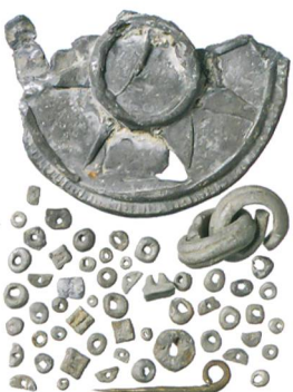
Abb. 2: Laupen. 2014 beim Goldwaschen entdeckte Metallfunde, neuzeitlich/modern. M. 1:1.

Aus den Flussbetten der Saane und Sense bei Laupen werden seit dem 19. Jahrhundert immer wieder archäologische Objekte geborgen (Abb. 1). Zu diesen Zufallsfunden gesellt sich nun ein interessantes Fundensemble, das Christoff Affolter 2014 dem Archäologischen Dienst des Kantons Bern übergab. Unter seinen beim Goldwaschen aufgesammelten Funden fallen neben zahlreichen modernen Objekten (Abb. 2) auch prähistorische und römische archäologische Funde auf.