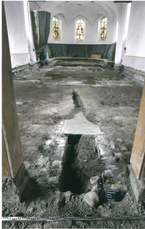
Abb. 6: Münsingen, Kirche. Der Kanal der Warmluftheizung von 1907. Blick nach Osten.

1907 wurde der Berner Münsterbaumeister Karl Indermühle beauftragt, den Innenraum der Kirche dem Zeitgeschmack entsprechend zu erneuern und 1915 dem Schiff im Westen eine Vorhalle anzufügen (Abb. 2, Phase VII, violett). Im Mittelgang des Kirchenschiffs wurde ein mit