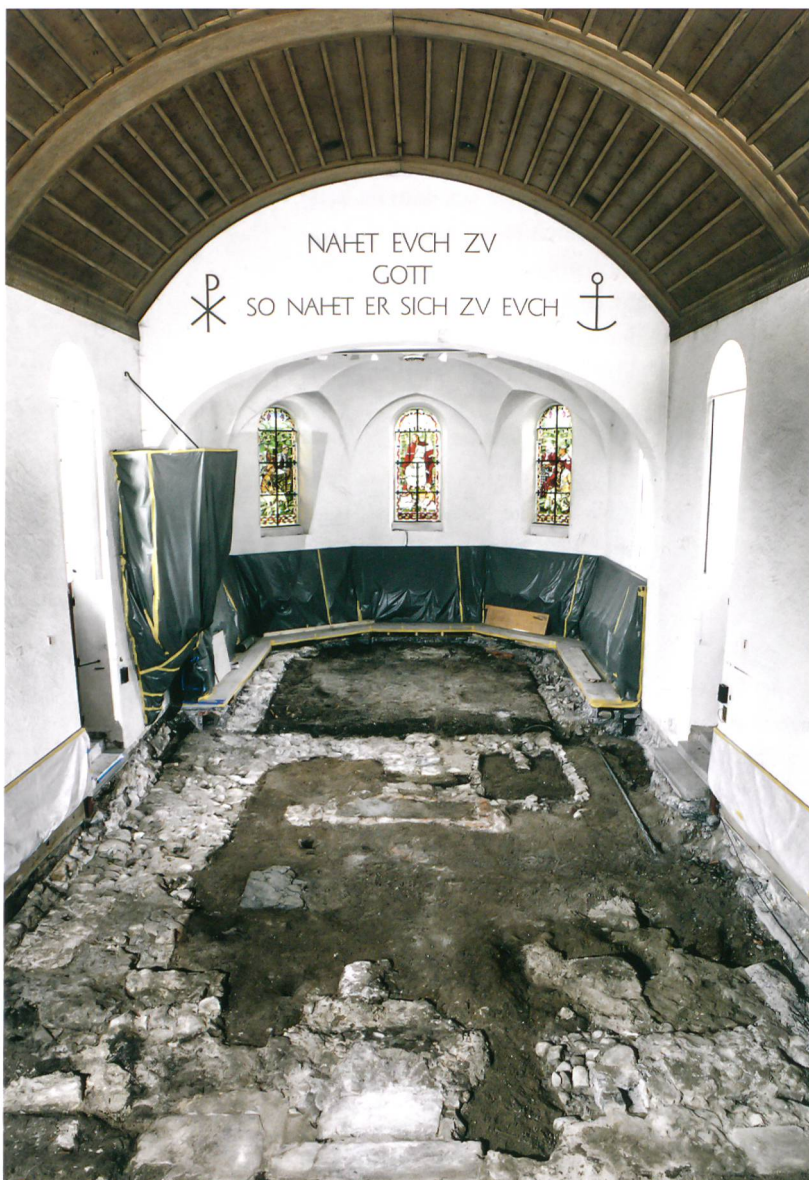
Abb. 1: Münsingen, Kirche. Die sichtbaren älteren Kirchgrundrisse nach der Entfernung des Bodens. Blick nach Osten.

vor Errichtung des heutigen Predigtsaales aus dem frühen 18. Jahrhundert bestanden haben.