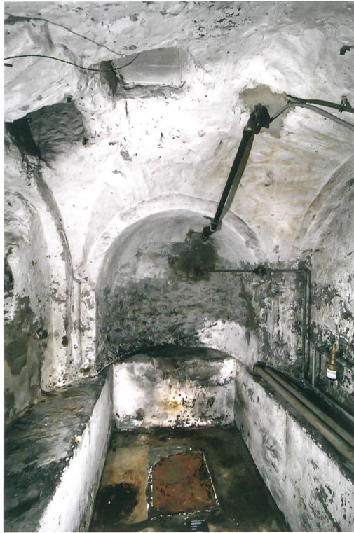
Abb. 4: Münsingen, Kirche. Die romanische Krypta im Untergeschoss des südlichen Annexes unter dem gotischen Turm. Blick nach Osten.

Kirchenbauten des Thunerseegebietes, die als dreischiffige Basiliken errichtet wurden. Dem vor- bis frühromanischen Kirchenbau ist die heutige Krypta unter dem Turm zuzuordnen – eine zeitgemässe Erneuerung des spätantiken Kultgebäudes als zweigeschossige Seitenkapelle oder als Kryptenraum unter einem Querhausarm? Das Erscheinungsbild spricht für eine Entstehung in vor- oder frühromanischer Zeit, im 11. oder frühen 12. Jahrhundert (Abb. 4). Der etwa 3 × 3 m grosse Raum zeigt ein von vier halbrunden Pfeilern getragenes Kreuzgewölbe mit scharfen Graten und eine kräftig herausgearbeitete Apsis im Osten. Dort ist ein Altar anzunehmen. Damals bestand vielleicht noch ein Zugang vom Südannex beziehungsweise vom Querhaus der Kirche. Heute ist der Raum nur noch über eine Treppe von aussen erschlossen.