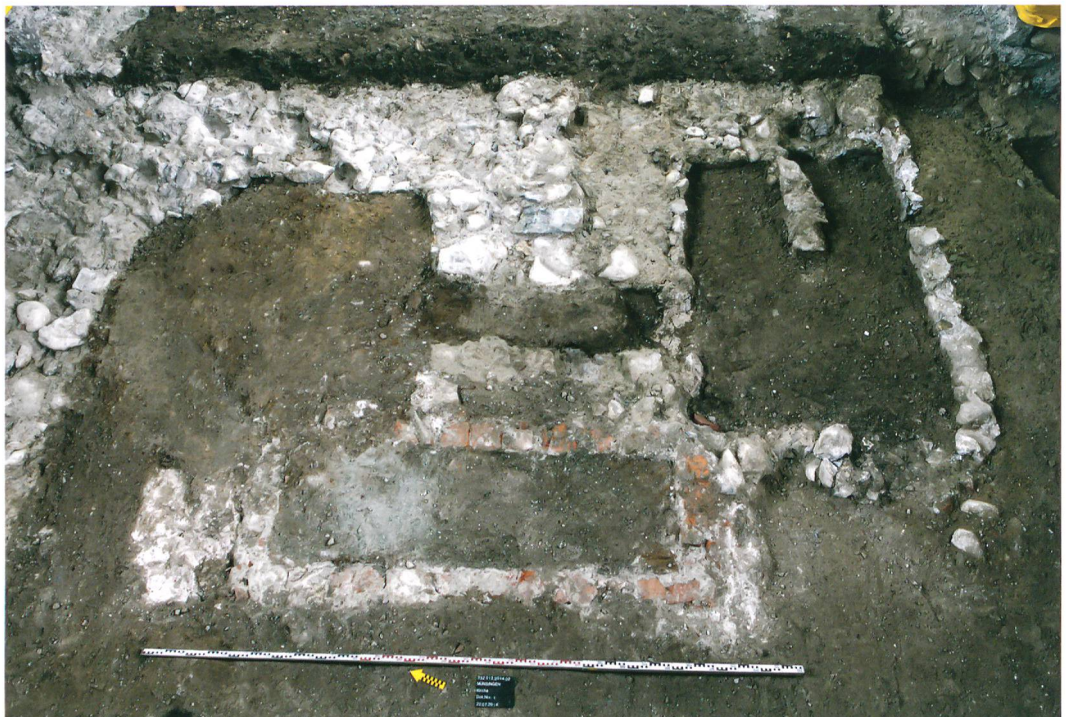
Abb. 5: Münsingen, Kirche. Grabgruben schneiden den Rechteckchor der frühromanischen Kirche. Blick nach Osten.

eine kreuzförmige Kirche. Auf Höhe der westlichen Choransätze ist ein Triumphbogen zu rekonstruieren, der das Sanktuarium, das den Geistlichen vorbehalten war, vom Langhaus, dem Aufenthaltsort der Gemeinde, trennte. Die Münsinger Kirche unterscheidet sich mit ihrer Saalform von den meisten romanischen