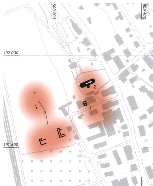
Abb. 3: Münsingen, Kirche. Übersichtsplan der bisher gefundenen Strukturen der römischen Villa im heutigen Kirchenbezirk. 1 Das 1941 freigelegte Badegebäude; 2 Bereich des angenommenen Herrenhauses des Gutshofes, Sondierungen 2000-2001; 3 weitere römische, nicht näher interpretierbare Befunde, diverse Grabungen ab 1988. M. 1:5000.

Abb. 2: Münsingen, Kirche. Übersichtsplan mit den nachgewiesenen Phasen. Grün: römisch, frühmittelalterlich; rot: karolingisch-ottonisch; orange: vor- oder frühromanisch; hellblau: Grabgruben aus verschiedenen Zeiten; gelb: gotisch; braun: 1709; violett: 1907. M. 1:250.